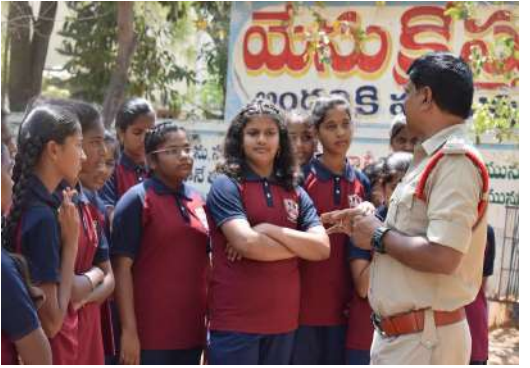
ప్రజలు బాధితులుగా మిగలకుండా ధైర్యంగా ఎదుర్కొని ఎలా సేఫ్ అయ్యారో ఈ సందర్భంగా తెలియజేశారు.

- 100. 112 సోషల్ మీడియాలో చోటు చేసుకుంటున్న వివిధ సైబర్ నేరాలు గురించి వివరించారు. సైబర్ నేరాలైన డిజిటల్ ______ అరెస్టు ఫెడెక్స్ కొరియర్ ఫ్రాడ్స్ , ఇన్వెస్ట్రెంట్ క్రిపోట్ స్టాక్ మార్కెట్ ఫ్రాడ్ డెబిట్ క్రెడిట్ కార్డు ఫ్రాడ్ యూపీఐ ఫ్రాడ్, పార్ట్ టైం జాబ్ టాస్క్ జాబ్ డ్రాడ్ ఏపీకే లింక్ మెసేజీ థ్రాడ్ ఏ ఈ పి ఎస్ థ్రాడ్ , ఫేక్ లోన్ యాప్ థ్రాడ్స్ పై అవగాహన చేశారు. జిల్లాలో ఇటీవల చోటు చేసుకున్న సైబర్