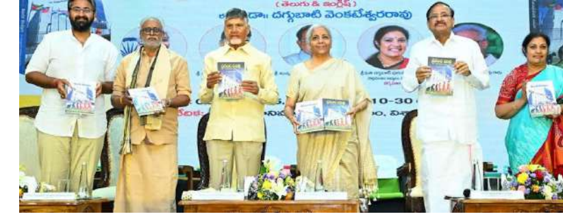
అమరావతి (ప్రశ్న న్యూస్) తెలుగుజాతి అగ్రభాగాన ఉండాలన్నదే తన ఆశయం అని ముఖ్యమంత్రి నారా చంద్రబాబు అభిప్రాయపడ్డారు. భారీ లక్ష్యాలను సాధించి రాష్ట్ర భవిష్యత్ ను మార్చాలన్నది తన కలగా

- ఆయన రాసిన 'ప్రపంచ చరిత్ర' మరింత అద్భుతమైంది