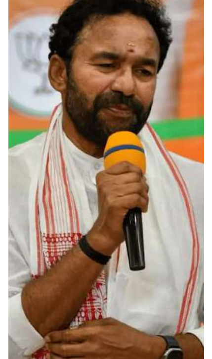
హైదరాబాద్ (ప్రశ్న న్యూస్) "ఎవరైనా గట్టిగా <u>ತ್ರಾದಕ್ಕಾರು, ಶೆಕ್ಷಚಾತ್ರ ಗುರಿ ಮಾಸಿ ತ್ರಾದಕ್ಕಾರು,</u> ఈయనేంట్రా పద్ధతిగా అంటు కట్టినట్లుగా కొట్టాడు" అని ఓ సినిమాలో డైలాగ్ ఉంటుంది.