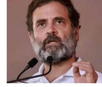
న్యాయస్థానం ఆయనకు 200 రూపాయల జరిమానా విధించింది.