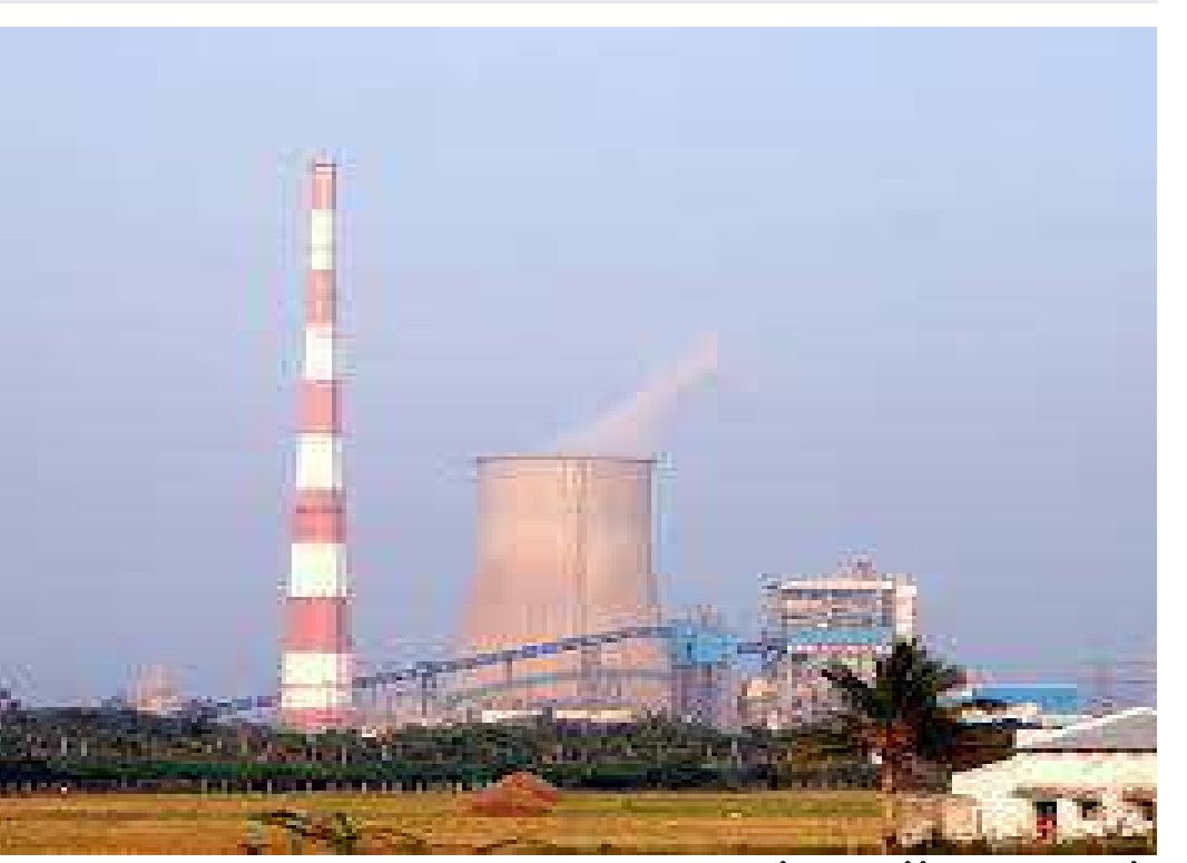
జరిగిన ప్రమాదం పూర్తిగా ప్లాంట్ అధికారుల నిర్లక్ష్మ వైఖరి మెగా వాట్ వ కారణమని వాదనలు బలంగా వినిపిస్తున్నాయి. వారికి పనుణ

డాక్టర్ ఎస్టిటిపీఎస్ 800 మెగావాట్ విద్యుత్ ప్రాంట్ లో కార్మికుడి మృతి పూర్తిగా భద్రతా వైఫల్యమే కారణమని తోటి కార్మికులు చెబుతున్నారు. ప్రాంట్ లో పని చేసే కార్మికులకు భద్రతా పరికరాలు అందించడంలో యాజమాన్యం నిర్లక్ష్యం మహిస్తున్నట్లు ఆరోపణలు ఉన్నాయి. కనీస అవగాహన, అనుభవం లేని కాంట్రాక్టర్ కు వాటర్ ట్రీట్ మెంట్ ప్రాంట్ లోని రబ్బర్ లైనింగ్ పనులు అప్పగించిన యాజమాన్యం వారు చేస్తున్న పనులు పర్యవేక్షణ లో కూడా విఫలం చెందినట్లు తెలిసింది. ఎలాంటి అనుభవం లేని కాంట్రాక్టర్ కు పనులు ఇవ్వడం తో సదరు కాంట్రాక్టర్ కనీస భద్రత చర్యలు పాటించకుండా కార్మికులను పని లోకి దించినట్లు సమాచారం. పని పట్ల కార్మికులకు అవగాహన లేకపోవడం తో కెమికల్ గ్యాస్ సాల్యూషన్ బీక్ కావడం తో ఊపిరి ఆదక ఇద్దరి కార్మికుల్తో ఒకరు మృతి చెందగా మరొకరు పరిస్థితి విషమంగా మారింది.