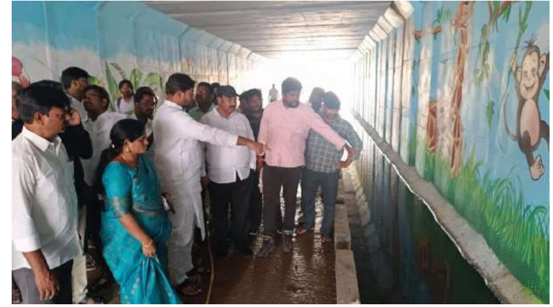
విన్నవించుకున్నారు. వెంట్ కు అనుగుణంగా అట్రోచ్ రోడ్డు 50 అడుగుల మేర ఉండాలని కోరారు. దీనికి ఎమ్మెల్యే నసీర్ స్పందిస్తూ వెంట్ 50 అడుగుల<sup>ే</sup>మేర ఉందని, అప్రోచ్ రోడ్డు కూడా 50 అడుగులు ఉండేలా మార్పు చేయాలని సంబంధిత అధికారులకు సూచించారు. ప్రస్తుతం 40 అదుగుల మేర మాత్రమే నిర్మాణాలు చేపట్టారని, దీంతో రాబోయే రోజుల్లో సమస్యలు ఎదురవుతాయని వివరించారు. వెంటనే 40 అదుగుల మేర ఉన్న అప్రోచ్ రోద్డును 50 అదుగులకు మార్పు చేయాలని అధికారులను ఆదేశించారు. ఎన్నో ఏళ్లుగా అపరిష్మ్రతంగా ఉన్న మూడు వంతెనల వద్ద నిర్మాణాలను సీఎం చంద్రబాబు నాయుడు ఆధ్వర్యంలో కూటమి ప్రభుత్వం ప్రతిష్టాత్మకంగా చేపట్టిందని తెలిపారు. ఈ నిర్మాణాలను ప్రజలకు అనుకూలంగా మార్చి త్వరలోనే అందుబాటులోకి తీసుకొస్తామని వెల్లడించారు. త్వరితగతిన పూర్తి చేయాలని సంబంధిత అధికారులకు ఎమ్మెల్యే నజీర్ సూచించారు.

గుంటూరు (ప్రశ్న న్యూస్) ప్రజాభీష్టం మేరకు మూదు వంతెనల నిర్మాణాన్ని చేపదుతున్నామని, రాబోయే తరాలకు ఇది మరింత సౌకర్యంగా ఉండేలా తీర్చిదిద్దుతున్నామని గుంటూరు తూర్పు ఎమ్మెల్యే మొహమ్మద్ నసీద్ అన్నారు. మూడు వంతెనల వద్ద నిర్మాణాలను సోమవారం ఎమ్మెల్యే పరిశీలించారు. ఈ సందర్భంగా స్థానిక (పజలు ఎమ్మెల్యేని కలిసి తమ సమస్యను