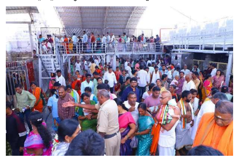
తరలివచ్చిన భక్తులు ఆలయ కళ్యాణకట్లలో తల నీలాలు సమర్పించి ధర్మగుండంలో పవిత్రస్నానాలు ఆచరించారు. అనంతరం స్వామివారిని దర్శించుకొని తరించారు. కోడెమొక్కుల క్యూలైన్లో సుమారు రెండు గంటలపాటు నిరీక్షించారు. స్వామివారికి (పీతిపాత్రమైన కోడెమొక్కులు చెల్లించుకున్నారు.