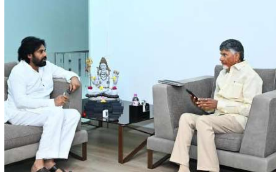
సమాచారం. అభ్యర్థలుగా ఎవరిని ఎంపిక చేయాలనే దానిపై ఇరువురు చర్చించినట్లు తెలిసింది. ఏపీలో ఐదు ఎమ్మెల్వే కోటా

అమరావతి (ప్రశ్న న్యూస్) ఏపీ అసెంబ్లీ బడ్జెట్ సమావేశాలు జరుగుతున్న వేళ ఆసక్తికర పరిణామం చోటుచేసుకుంది. ఏపీ డిప్యూటీ సీఎం పవన్ కళ్యాణ్ ముఖ్యమంత్రి నారా చంద్రబాబు నాయుడు ఛాంబర్కు వెళ్లారు. అసెంబ్లీలోని చంద్రబాబు ఛాంబర్కు వెళ్లిన పవన్ కళ్యాణ్ గంటపాటు ఆయనతో చర్చలు జరిపారు, ఏపీ బడ్జెట్, వివిధ శాఖలకు కేటాయింపుల చర్చించినట్లు తెలిసింది. అలాగే తల్లికి వందనం, అన్నదాత పథకాల అమలుపైనా ప్రధానంగా చర్చ జరిగినట్లు సమాచారం. వీటితో పాటు పలు రాజకీయ అంశాలపై ఇద్దరు నేతల మధ్య చర్చ జరిగినట్లు తెలిసింది. ముఖ్యంగా ఏపీలో ఎమ్మెల్యే కోటా ఎమ్మెల్సీ ఎన్నికలకు షెడ్యూల్ విడుదలైన సంగతి తెలిసిందే. ఎమ్మెల్సీ ఎన్నికలపైనా సీఎం చంద్రబాబు, డిప్యూటీ సీఎం పవన్ కల్యాణ్ చర్చించినట్లు