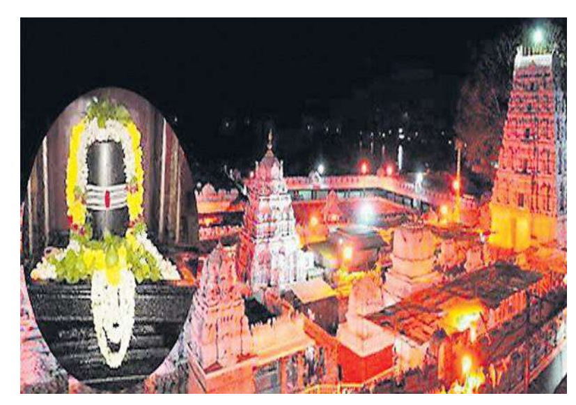
పర్యాటక సందడి తిరిగి మొదలైంది. కోవిడ్ కారణంగా చాలా కాలంగా ఇళ్లకే పరిమితమైన నగరవాసులు కాలక్షేపం కోసం పర్యటనలకు ప్రణాళికలు సిద్ధం చేసుకుంటున్నారు. ఈ క్రమంలో తెలంగాణ పర్యాటకాభివృద్ధి సంస్థ పర్యాటకుల అభిరుచికి అనుగుణమైన ప్యాకేజీలను రూపొందించింది. నగరంలోని చారిత్రక, పర్యాటక ప్రాంతాలను సందర్శించేందుకు ఏసీ, నాన్ ఏసీ బస్సుల్లో హైదరాబాద్ను సందర్శించే సదుపాయాన్ని అందుబాటులోకి తెచ్చింది.