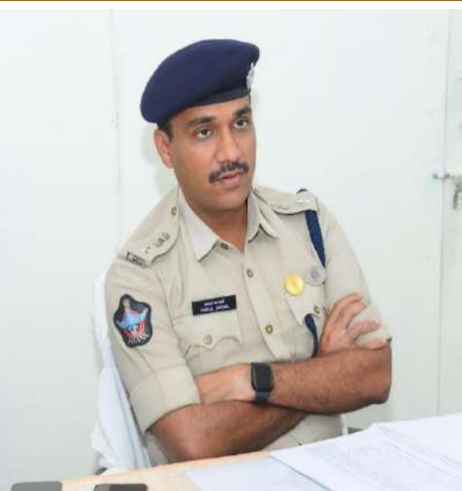
అప్రమత్తమై, వారున్న ప్రాంతానికి క్షణాల్లో చేరుకొని, మహిళలకు రక్షణగా నిలుస్తారన్నారు. కావున, ప్రతీ ఒక్కరూ తమ మొబైల్ ఫోన్లలో శక్తి యాప్ ను డౌన్లోడు, రిజిస్ట్రేషన్ చేసుకోవాలని జిల్లా ఎస్పీ వకుల్ జిందల్ విద్యార్థినులు, మహిళలకు విజ్ఞప్తి చేశారు.

భయపడకుండా, పరిస్థితిని అర్థం చేసుకొని, వాటిని ఎదుర్కొనేందుకు మానసికంగా సిద్ధమయ్యే విధంగా విద్యార్థినులు అప్రమత్తం కావాలన్నారు. నమస్సు నుండి బయట పడేందుకు ఆత్మవిశ్వాసం, ధైర్యంతో ముందడుగు వేవాలని, ఎవరైనా అనుమానస్పందంగా అనుసరిస్తున్నారని భావిస్తే, జనం ఉన్న ప్రదేశాల్లోకి వెంటనే వెళ్ళేందుకు ప్రయత్నించడం, ఇతరుల సహాయం పొందే విధంగా బిగ్గరగా అరవడం చేయాలన్నారు. అగంతకులు దాడికి పాల్పడే సమయాల్లో ఆత్మ రక్షణ కొరకు ఎదురు దాడికి దిగి, దాడికి పాల్పడిన వ్యక్తుల సున్నితమైన భాగాలను లక్ష్యంగా చేసుకోవాలని, కళ్ళలో కొట్టడం, ముక్కుపైన గుద్దడం, కాళ్ళ మధ్య భాగంలో తన్నడం చేయాలన్నారు. ఆత్మ రక్షణకు కొన్ని సెల్ఫ్ టెక్నిక్స్ ను విద్యార్థినులు, మహిళలు తప్పనిసరిగా తెలుసుకోవాలని ఎస్పీ వకుల్ జిందల్ సూచించారు. ప్రతీ మహిళ తమ మొబైల్ ఫోన్లలో తప్పనిసరిగా శక్తి యాప్ ను డౌన్లోడు చేసుకోవాలని, అత్యవసర పరిస్థితుల్లో దుర్లో 112 100, శక్తి యాప్ లోని ఎస్.ఓ.ఎస్. బటన్ ను ప్రెస్ చేయాలన్నారు. మొబైల్ ఫోన్లలో శక్తి యాప్ నిక్షిప్తమై ఉంటే మీకు రక్షణగా ఒక కుటుంబ సభ్యుడు మీతో ఉన్నట్టేనన్నారు. ఆపద సమయంలో శక్తి యాప్ లోని ఎస్.ఓ.ఎస్. బటన్ ను ప్రెస్ చేస్తే, వారున్న ప్రాంతం వివరాలను, 10 సెకన్ల ఆడియో, వీడియోలను దగ్గరలో ఉన్న పోలీసు స్టేషనుకు చేరుతుందని, తప్పారా పోలీసులు