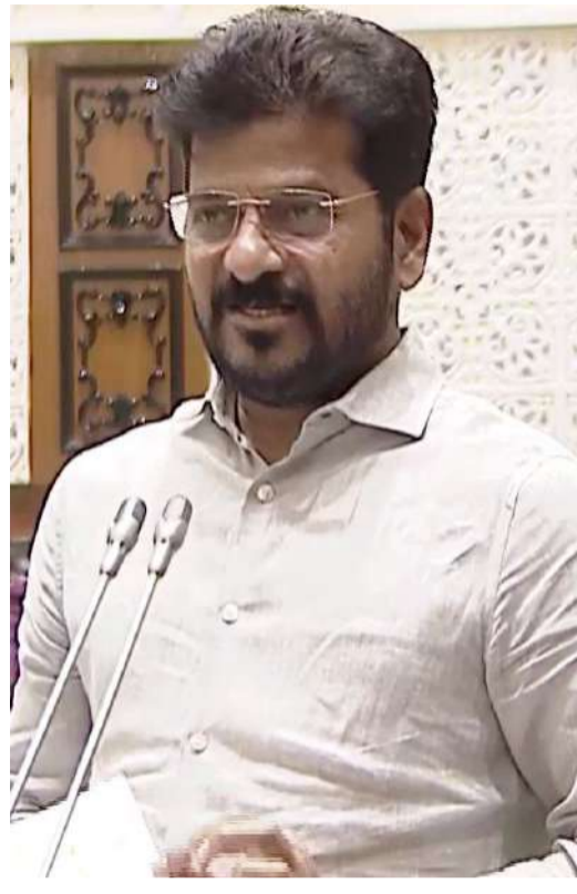
సర్వత్రా చర్చనీయాంశంగా మారింది.

తెలిపారు. ఇలాంటి విషయాలపై దృష్టి పెట్టకుండా ప్రజా సమస్యలపై దృష్టి పెట్టడం మంచిదని రేవంత్ రెడీ సూచించారు. ఇతర పార్టీల నేతలు తమతో చేరినా, చేరిన వాళ్లు వెనక్కి వెళ్లినా ఉపఎన్నికలు రావని ఖరాఖండిగా చెప్పారు రేవంత్ రెడీ. రాష్ట్ర అభివృద్ధిపైనే తాను దృష్టి పెట్టానని, ఇలాంటి విషయాలపై దృష్టి పెట్టి సమయం వృథా చేసుకోవని చెప్పుకొచ్చారు. ఈ కేసు సుప్రీంకోర్టులో ఉన్నందున తీర్పు వచ్చాక ఏదైతే అది అవుతుందని అన్నిటికీ తాము సిద్ధంగా ఉన్నామని రేవంత్ స్పష్టం చేశారు. అసెంబ్లీ ఎన్నికల తర్వాత బీఆర్ఎస్ నుంచి గెలిచిన 10 మంది ఎమ్మెల్యేలు కాంగ్రెస్ పార్టీలోకి మారిన విషయం తెలిసిందే. కాగా ఆ 10 మంది మీద అనర్హత వేటు వేయాలంటూ బీఆర్ఎస్ పార్టీ హైకోర్టును ఆశ్రయించగా స్వీకర నిర్ణయాలనికి వదిలేసింది. దీంతో ఈ వ్యవహారంపై బీఆర్ఎస్ నేతలు సుప్రీం కోర్టును ఆశ్రయించారు. ప్రస్తుతం సుప్రీం కోర్టులో ఈ వ్యవహారం నడుస్తుండగా అందరూ ఆసక్తికరంగా ఎదురు చూస్తున్నారు. పార్టీ ఫిరాయించిన వారంతా రాజీనామా చేసి ఉపఎన్నికలకు వెళ్లారని రాష్ట్రంలో చర్చలు జరుగుతున్నాయి. ఈ నేపథ్యంలో ఉపఎన్నికలపై సీఎం రేవంత్ రెడీ క్లారిటీ ఇవ్వటం