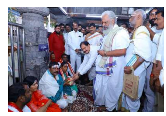
డ్రేణులు పుష్ప గుచ్చాన్ని అందజేసి, ఘనంగా స్వాగతం పలికారు.