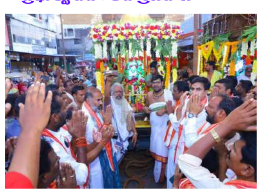
వేములవాడ,(ప్రత్న న్యూస్) వేములవాడ (శ్రీరాజరాజేశ్వర