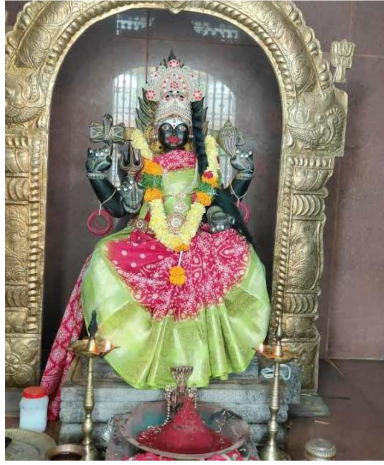
అమ్మవారి కాళ్లకున్న వెండి మెట్టెలు, ఆలయ వార్షికోత్సవానికి విరాళంగా వచ్చిన రూ. పది వేల నగదు, ఆహుజ ఆంప్లిఫయిర్ ను దుండగులు ఎత్తుకెళ్లినట్లు సమాచారం అక్కదున్న కాలిని వాసులు వివరాల తెలిపిన ప్రకారం పోలీస్ కేసు నమోదు చేసుకొని . దుండగులను తొదర్లో పట్టుకుంటామని తెలిపారు.

మేద్చల్ ( స్రహ్మ్ స్యూస్ ) మేద్చల్ పోలీస్ స్టేషన్ పరిధిలోని తుమ్మ చెరువు కట్టమైసమ్మ అమ్మవారి ఆలయంలో శుక్రవారం రాత్రి గుర్తు తెలియని దుండగులు ఆలయ తాళాలు పగలగొట్టి గర్భగుడిలోకి చొరబడి అమ్మవారి మెదలో ఉన్న తులం బంగారం పుస్తెలతాడు, ముక్కుపుదక,