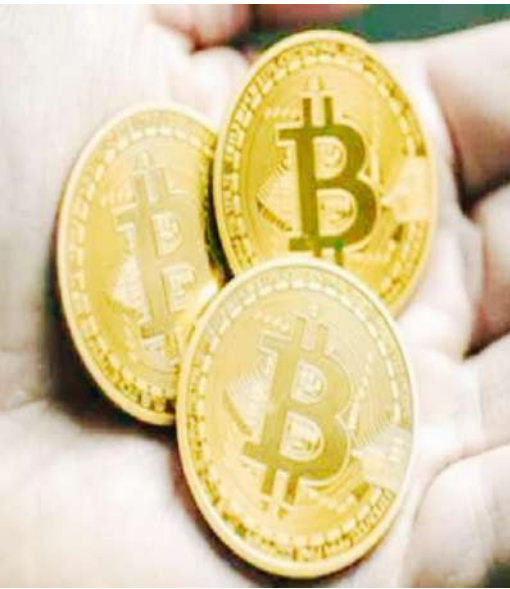
దీనిపై ఇంకా కేసు సమయం కాలేదని తెలిపారు.

లక్షల వరకు పెట్టుబడులు పెట్టించారని వారు వాపోయారు. పెట్టుబడి పెట్టిన డబ్బులు తిరిగి రాకపోవడంతో వారంతా రాకేట్ ను నిలదీశారు. దాదాపు 8 నెలలుగా రేపు, మాపు అంటూ తిప్పించుకుంటున్నారని బాధితులు ఆగ్రహం వ్యక్తం చేశారు. చివరకు బాధితులు కొందరు రాకేట్ ఇంటి వద్దకు వెళ్ళగా, అతను లేకపోవడంతో వారంతా ఆందోళన చేపట్టారు. దీంతో రాకేట్ కుటుంబ సభ్యులు 100కు దూరం చేసి పోలీసులకు సమాచారం ఇచ్చారు. పోలీసులు అక్కడకు చేరుకుని ఫిర్యాదు ఇవ్వాలని బాధితులకు సూచించారు. విషయం తెలియడంతో రాకేట్ మంటన బాధితులతో మాట్లాడాడు. కొంత సమయం ఇస్తే డబ్బులు మొత్తం తిరిగి ఇస్తానని హామీ ఇవ్వడంతో బాధితులు పోలీసులకు ఫిర్యాదు ఇవ్వకుండానే వెళ్లిపోయారు. డబ్బులు అడిగినప్పుడల్లా ఇలానే రాకేట్ దాటవేస్తూ వస్తున్నారని బాధితులు ఆరోపించారు. అయితే బాధితులు ఫిర్యాదు చేయకపోవడంతో