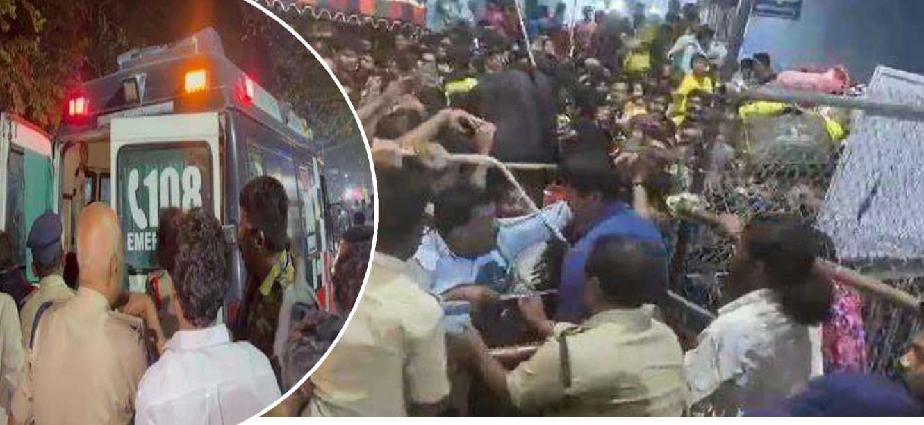
చేశారు గాయపడ్డ వారికి మెరుగైన అధికారులకు ఆదేశించారు. ఈ ఘటనపై డిప్యూటీ సీఎం పవన్ కళ్యాణ్, మంత్రి వైద్యం అందించాలని సీఎం చంద్రబాబు లోకేశ్, మాజీ సీఎం జగన్ తీవ్ర దిగ్భ్రాంతిని వ్యక్తం చేశారు.