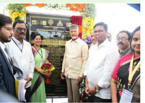
అన్నారు.'జననాయకుదు' పోర్టల్ అందుబాటులోకి

కుప్పం నియోజకవర్గం ఎప్పుడూ గుర్తు చేశారు. కుప్పంలో ఇంతవరకు వేరే పార్టీ గుర్తు గెలవలేదని