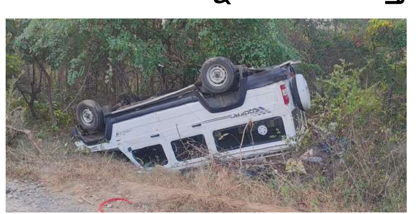
వరంగల్ ఖానాపురం మండలం చిలకమ్మ నగర్ సమీపంలోని కొత్తగూడ సరిహద్దు ప్రాంతంలో గాదే వాగు మూలమలుపు వద్ద అదుపు తప్పిన తుఫాన్ వాహనం బోల్తా పడింది. ఘటన