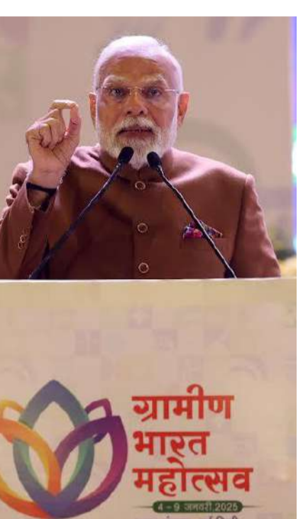
గ్రామీణ భారత మహోత్సవం 2025 కార్యక్రమంలో ప్రధాని మోడీ