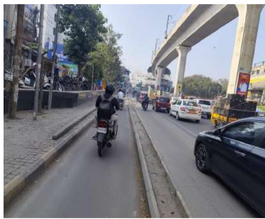
(ఆర్ కె - ప్రశ్న న్యూస్ బ్యూరో)

గ్రేట్ హైదరాబాద్ నగరంలో ప్రజల సంఖ్య రోజురోజుకూ భారీగా పెరుగుతోంది. ప్రస్తుతం గ్రేట్ హైదరాబాద్ లో దాదాపు రెండు కోట్ల మంది ప్రజలు నివసిస్తున్నట్లు ఇటీవల ప్రభుత్వం తెలిపింది. దానికి అనుగుణంగా రోడ్ల విస్తరణ పెరగాలి. అయితే రోడ్డు విస్తరణ పెంచడం ఒకపక్క జరుగుతుంటే మరోపక్క కొంతమంది అధికారుల అవగాహన రాహిత్యం లేక తెలివి తక్కువ పనో కానీ రోడ్లను సైకిల్ ట్రాక్ పేరుతో చాలావరకు చిన్నగా చేశారు. దానికి తోడు ఎక్కడపడితే అక్కడ ఫుట్ పాత్ ల అధునికరణ పేరుతో పెద్దగా చేసి రోడ్లను మరింత చిన్నవిగా చేశారు గత బీఆర్ ఎస్ ప్రభుత్వంలో అయితే అప్పుడు ప్రజలు సైకిల్ ట్రాక్ తీవ్ర అగ్రహాన్ని వ్యక్తం చేశారు. గ్రేట్ హైదరాబాద్