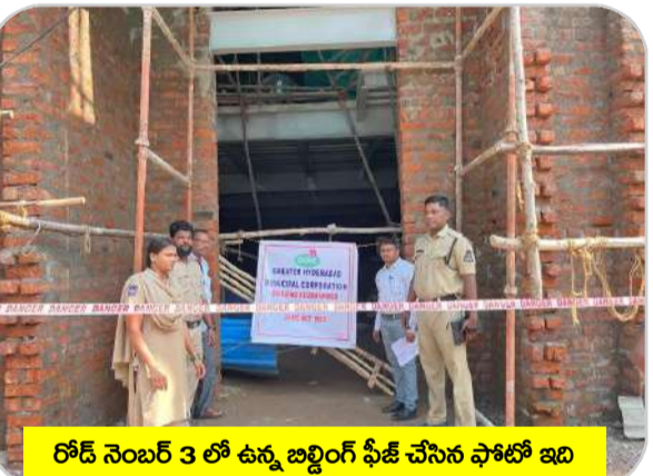
రోడ్ నెంబర్ 3 లో ఉన్న బిల్డింగ్ సీజ్ చేసిన ఫోటో ఇది