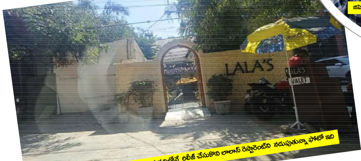
సీజ్ చేసిన గంటల పువ్వులోనే లిబిజ్ చేసుకొని లాలాస్ రెస్టారెంట్ ని గురువుచూస్తూ ఫోటో ఇది