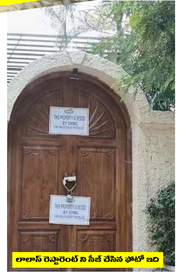
లాలాస్ రెస్టారెంట్ ని సీజ్ చేసిన ఫోటో ఇది

నిర్మాణదారులు సీజ్ చేసిన ప్లెక్స్ లను తొలగించి భావన నిర్మాణ పనులు బహిరంగంగా నిర్వహిస్తున్న సీజ్ చేసిన అధికారి ఎందుకు పట్టనట్లు వ్యవహరిస్తున్నారు.? సీజ్ చేశా నా పని ఇంతవరకే అంటూ పట్టించుకోక పోవటం ఏంటి.? సీజ్ చేసిన బిల్డింగ్ లో పనులు నిర్వహించటం ప్రభుత్వం నిబంధనలకు విరుద్ధం.ఈ అంశం చాలా సీరియస్ గా తీసుకోవాలి కాని పదిహేను రోజులవుతున్నా అధికారులలో చలనం లేదు. సీజ్ చేసే సమయంలో పోలీసులతో అధికారులు సీజ్ చేసినట్టు ప్లెక్స్ పెట్టి పోటోలు దిగి వాటిని పై అధికారులకు పంపి తమ పని అయిపోయిందని వదిలేశారు. సీజ్ చేసిన భవనంలో