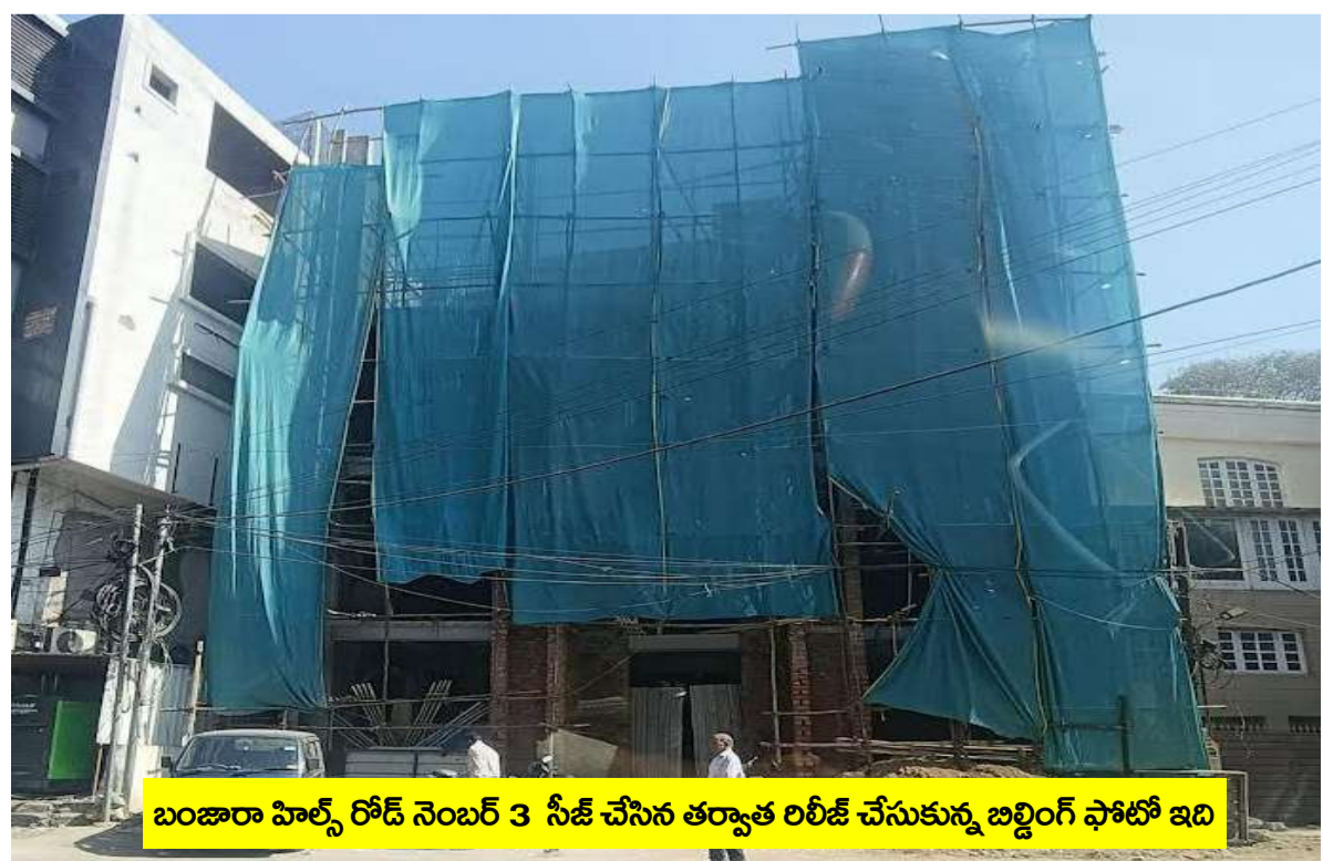
బంజారా హిల్స్ రోడ్ నెంబర్ 3 సీజ్ చేసిన తర్వాత లిబిజ్ చేసుకున్న బిల్డింగ్ ఫోటో ఇది