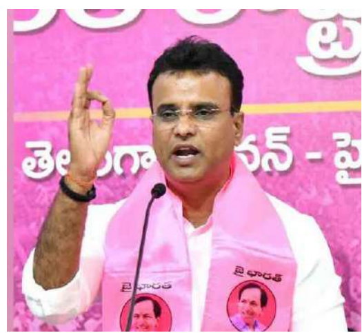
అప్పటి పరిశ్రమల శాఖా మంత్రి కేటీఆర్ చొరవతో టాటా గ్రూప్, గోద్రెజ్ సంస్థ పెట్టబడులు పెట్టడానికి ముందుకు

కాంగ్రెస్ ప్రభుత్వ పనితీరు వల్ల వచ్చాయని చెప్పుకుంటున్న రూ. 40,232 కోట్ల పెట్టబదుల్లో అసలు నిజాలు ఏమిటి ? అదాని సంస్థలకు చెందిన రూ. 12,400 కోట్ల పెట్టుబడి అనుమానాస్పదంగానే ఉందని స్పష్టం చేశారు. గోడి కంపెనీ రూ. 160 కోట్ల విలువ చేసే ఒక చిన్న షెల్ కంపెనీ తెలంగాణలో రూ. 8,000 కోట్లు పెట్టుబడి ఎలా పెడుతుందనే సందేహాలు ఉత్పన్నమవుతున్నాయని ఎమ్మెల్యే వెల్లడించారు. జేఎస్డబ్లూ సంస్థ ప్రకటించిన రూ. 9,000 కోట్ల పెట్టబడి, వెబ్ వర్మ్ సంస్థ ప్రకటించిన రూ. 5,200 కోట్ల పెట్టుబడి, గోద్రెజ్ సంస్థ ద్రకటించిన రూ. 1,270 కోట్ల పెట్టబడిలో రూ. 300 కోట్లు గత బీఆర్ఎస్ హయాంలో జరిగినవేనని తెలిపారు.