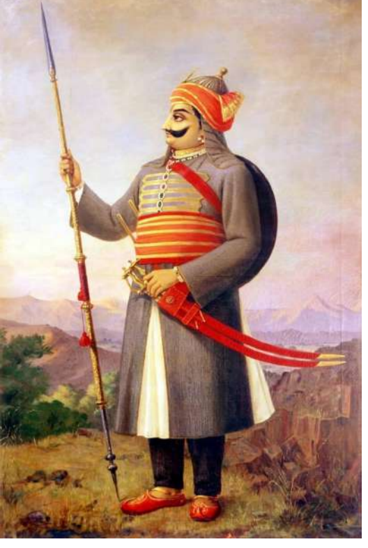
జనవరి 19 న చావంద్ వద్ద వేటకు వెళ్ళినప్పుడు ప్రమాదంలో గాయపడి రాజా ప్రతాప్ మరణించాడు. అప్పటికి అతడికి 56 సంవత్సరాల వయస్సు. అతని తరువాత అతని పెద్ద కుమారుడు మొదటి అమర్ సింగ్ రాజయ్యాడు.

సమీపంలోని హాల్దిఘాటి వద్ద ఒక ఇరుకైన కనుసు దారి. మహారాణా ప్రతాప్ సుమారు 3000 అశ్వికదళాలు, 400 మంది ఖిల్ విలుకాళ్ళను మోహించాడు. మొఘలు సేనలకు అంబరకు చెందిన మాన్ సింగ్ నాయకత్వం వహించాడు, అతని వెంట 5000-10,000 మంది సైనికులున్నారు. ఆరు గంటలకు పైగా జరిగిన ఖీకర యుద్ధం తరువాత, మహారాణా గాయపడ్డాడు. మొఘలు అతన్ని పట్టుకోలేకపోయారు. అతను కొండల్లోకి తప్పించుకోగలిగాడు.మహారాణా ప్రతాప్ ను లేదా ఉదయపూర్ లోని అతని దగ్గరి కుటుంబ సభ్యులను పట్టుకోలేక పోవడంతో, హాల్దిఘాటి విజయం మొఘలులకు నిర్లక్ష్యమైంది. సామ్రాజ్యం దృష్టి వాయవ్య దిశగా మారిన వెంటనే, ప్రతాప్ సస్పెన్షంగా అజ్ఞాతం లోంచి వచ్చి పశ్చిమ ప్రాంతాలను తిరిగి స్వాధీనం చేసుకున్నాడు. బెంగాల్, బీహార్ లో తిరుగుబాట్లు, మిర్జా హాకిమ్ వంజాభక్తి చొప్పుకు రావడం మొదలైన వాటి వల్ల 1579 తరువాత మేవార్ పై మొగలుల ఒత్తిడి సడలింది. 1582 లో మహారాణా ప్రతాప్, దావర్ వద్ద ఉన్న మొగలు స్థావరంపై దాడి చేసి ఆక్రమించాడు. ఇది మేవార్ లోని మొత్తం 36 మొఘల్ సైనిక కేంద్రాల మూసివేతకు దారితీసింది. ఈ ఓటమి తరువాత, అక్బర్ మేవార్ పై తన సైనిక చర్యలను ఆపాడు. దావర్ విజయం మహారాణా ప్రతాప్ కి దీరంబంలో ఇక కలికి తురాయి. జేమ్స్ టాడ్ దీనిని “మారథాన్ ఆఫ్ మేవార్”గా అభివర్ణించాడు.1585 లో, అక్బర్ లాహోర్ ను వెళ్లి, తరువాతి వస్త్రాంధ్రం నంపత్కారాలు అక్కడే ఉండి, వాయవ్యం లోని పరస్పతిని పర్యవేక్షించాడు. ఈ కాలంలో మేవార్ పై పెద్ద మొఘల్ దొంగయాత్ర ఏదీ జరగలేదు. ఈ పరిస్థితిని సద్వినియోగం చేసుకొన్న ప్రతాప్, కుంభాల్ గడ్డ, ఉదయపూర్, గోగుండలలో సహా పశ్చిమ మేవార్ ను స్వాధీనం చేసుకున్నాడు. ఈ కాలంలో, అతను ఆధునిక దుంగాల్ పూర్ సమీపంలో చావంద్ అనే కొత్త రాజధానిని కూడా నిర్మించాడు. ఒక కథనం ప్రకారం 1597