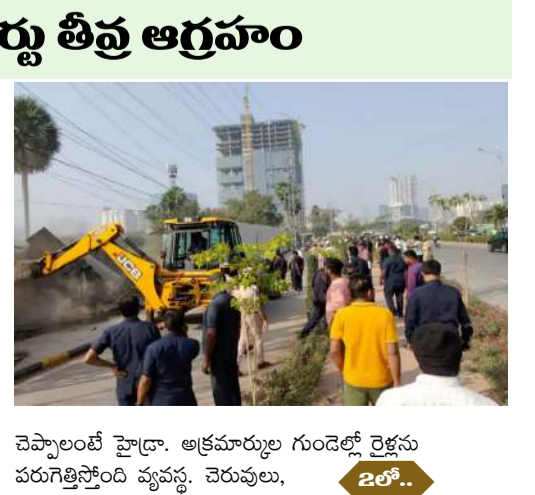
హైదరాబాద్ (ప్రశ్న స్వూస్) రెండు తెలుగు రాష్ట్రాల్లో మార్మోగుతున్న పేరు హైదరాబాద్ డిజాస్టర్ రిపాస్ అండ్ అసెస్స్ మానిరింగ్ అండ్ ప్రాజెక్ట్స్. సింపల్ గా చెప్పాలంటే హైద్రా. అక్రమార్కులు గుండెల్లో రెక్కను పరుగెత్తిస్తోంది వ్యవస్థ. చెరువులు,