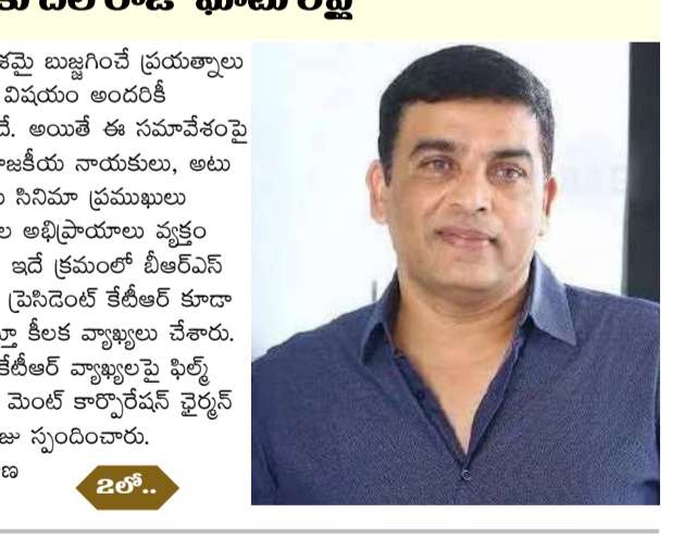
సమావేశమై బుజ్జగించే ప్రయత్నాలు జరిగిన విషయం అందరికీ తెలిసిందే. అయితే ఈ సమావేశంపై ఇటు రాజకీయ నాయకులు, అటు కొందరు సినిమా ప్రముఖులు రకరకాల అభిప్రాయాలు వ్యక్తం చేశారు. ఇదే క్రమంలో బీఆర్ఎస్ వర్కింగ్ ప్రెసిడెంట్ కేటీఆర్ కూడా స్పందిస్తూ కీలక వ్యాఖ్యలు చేశారు. దీంతో కేటీఆర్ వ్యాఖ్యలపై ఫిల్మ్ డెవలప్ మెంట్ కార్పొరేషన్ ఛైర్మన్ దిల్ రాజు స్పందించారు. తెలంగాణ

హైదరాబాద్ (ప్రశ్న స్వూస్) తెలంగాణలో రాజకీయాల రోజురోజుకు రసవత్తరంగా మారుతున్నాయి. అధికార ప్రతిపక్షాల మధ్య మాటల పోరుతో పాటు పూజల జోరు కూడా గట్టిగానే నడుస్తోంది. అయితే ఇటీవల సంధ్య ఢియేట్ తోక్కిన ఫుటబు సేవల్లో తెలుగు ఇండస్ట్రీపై రేవంత్ రెడ్డి సర్కార్ చాలా సీరియస్ అయ్యారు. ఈ మేరకు కాస్త కఠిన నిర్ణయాలు కూడా తీసుకున్నారు. దీంతో ఇండస్ట్రీ పెద్దలంతా కలిసి సీఎం రేవంత్ రెడ్డితో