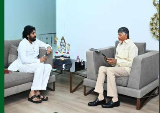
అమరావతి (ప్రశ్న న్యూస్) ఆంధ్రప్రదేశ్ ముఖ్యమంత్రి నారా చంద్రబాబు నాయుడుతో డిప్యూటీ సీఎం పవన్ కళ్యాణ్ భేటీ అయ్యారు. సోమవారం మధ్యాహ్నం ఉండవల్లిలోని చంద్రబాబు నివాస్తానికి వెళ్లిన పవన్ కళ్యాణ్ సుమారు