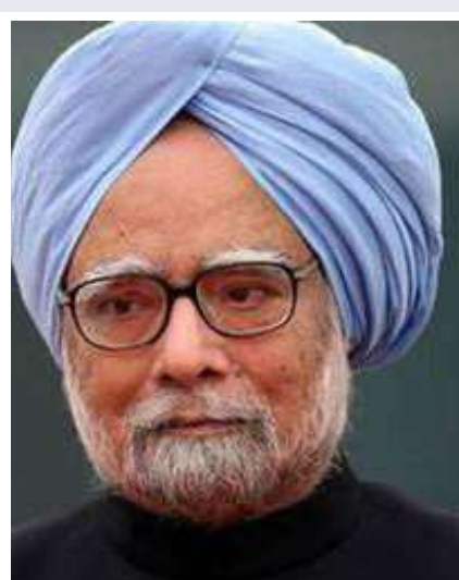
సంస్థల్లో పనిచేసే ఉద్యోగులకు హాఫ్ డే సెలవు ప్రకటించారు. స్మారక స్థలం నిర్మాణం కోసం ప్రధాని మోదీకి ఖర్చు లేఖ మన్మోహన్ సింగ్ కు అంత్యక్రియలు నిర్వహించే ప్రదేశంలో స్మారక స్థలం నిర్మించాలని కాంగ్రెస్ జాతీయ అధ్యక్షుడు మల్లికార్జున

- సైనిక లాంచనాలతో తుది వీడ్కోలు మన్మోహన్ (ప్రశ్న స్వాస్) మాజీ ప్రధాని మన్మోహన్ సింగ్ అంత్యక్రియలు నేడు అధికారిక లాంచనాలతో నిర్వహించనున్నారు. ఈ మేరకు కేంద్ర హోంశాఖ వెల్లడించింది. నేడు ఉదయం 11.45 గంటలకు ఆయన అంతిమ సంతాపాలు ఢిల్లీలోని నిగమ్ బోర్డ్ ఫూల్లో జరుగుతాయని తెలిపింది. సైనిక లాంచనాలతో తుది వీడ్కోలు పలికేందుకు తగిన ఏర్పాట్లు చేయాలని కేంద్ర రక్షణ శాఖను కోరినట్లు ఈ మేరకు ఓ ప్రకటనలో కేంద్ర హోంశాఖ తెలిపింది. కేంద్ర కేబినెట్ సంతాపం మన్మోహన్ సింగ్ మృతికి కేంద్ర కేబినెట్ సంతాపం తెలిపింది. ప్రధాని నరేంద్రమోదీ అధ్యక్షతన సమావేశమైన కేంద్ర కేబినెట్ సంతాప తీర్మానం చేసింది. మన్మోహన్ సింగ్ మృతికి సంతాపంగా రెండు నిమిషాలపాటు మౌనం పాటించారు. వచ్చే నెల 1వ తేదీ వరకు ఏడు రోజులపాటు సంతాపం దినాలుగా ప్రకటించారు. ఈ మేరకు కేంద్రం ఒక అధికారిక ప్రకటనను విడుదల చేసింది. ఈ 7 రోజులపాటు దేశవ్యాప్తంగా, విదేశాల్లోని ఇండియన్ మిషన్స్, రాయబార కార్యాలయాల్లో జాతీయ జెండాను సగం వరకు ఎగురవేయనున్నారు. అంత్యక్రియల రోజు కేంద్ర ప్రభుత్వ ఉద్యోగులకు, కేంద్ర ప్రభుత్వ రంగ