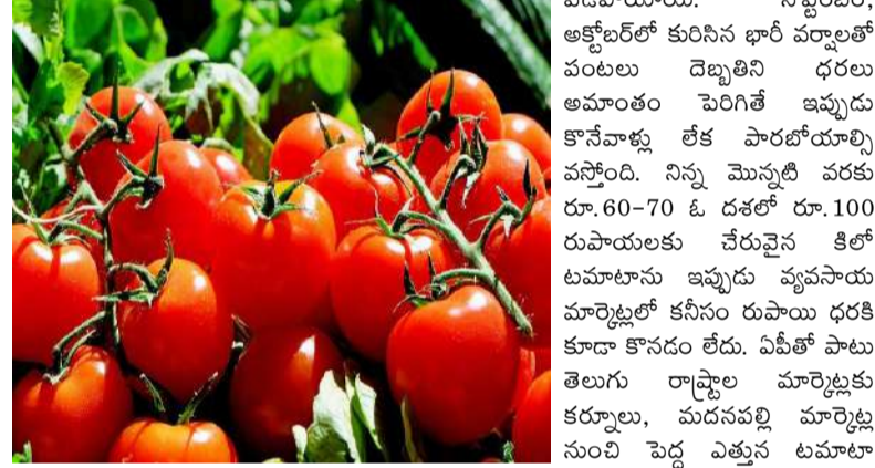
పడిపోయాయి. సెప్టెంబర్, అక్టోబర్లో కురిసిన భారీ వర్షాలతో పంటలు దెబ్బతిని ధరలు అసూయకం పెరిగితే ఇప్పుడు కొనేవాళ్లు లేక పారబోయాల్సి వస్తోంది. నిన్ను మొన్నటి వరకు రూ.60-70 ఓ దశలో రూ.100 రు.పాటులుకు చేరువైన కిలో టమాటాను ఇప్పుడు వ్యవసాయ మార్కెట్లో కనీసం రూపాయి ధరకి కూడా కొనడం లేదు. ఏపీలో పాటు తెలుగు రాష్ట్రాల మార్కెట్లకు కర్నూలు, మద్రసపల్లి మార్కెట్ల నుంచి పెద్ద ఎత్తున టమాటా విక్రయాలు జరుగుతుంటాయి.

కర్నూలు : నిన్ను మొన్నటి వరకు చుక్కల్ని తాకిన టమాటా, మిర్చి ధరలు ఒక్కసారిగా