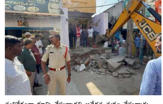
వ్యతిరేకంగా కూల్చి వేస్తున్నారని ఆవేదన వ్యక్తం చేస్తున్నారు.

మేడ్చల్ (ప్రశ్న స్కూన్) మేడ్చల్ పట్టణంలోని ప్రధాన మార్కెట్ దారిలోని ఫుట్ పాత్లపై వేసి ఉన్న అక్రమ నిర్మాణాలను గురువారం మున్సిపల్ అధికారులు కూల్చి వేశారు. ఫుట్పాత్లను కూల్చివేస్తున్న తరుణంలో ఎలాంటి నిబంధనలు పాటించకుండా కూల్చివేశారని బాధితులు ఆవేదన వ్యక్తం చేశారు. అనంతరం బాధితులు మాట్లాడుతూ రాష్ట్ర అత్యున్నత న్యాయస్థానం ఆదేశాలు ఉన్నప్పటికీ కూల్చివేతలు చేయడం ఏమేరకు సమంజసమని ప్రశ్నించారు. విధి విధానాలు పాటించకుండా అక్రమ నిర్మాణాలంటూ ఫుట్ పాత్లను కూల్చివేశారని బాధితులు ఆవేదన వ్యక్తం చేశారు. ఎలాంటి నోటీసులు ఇవ్వకుండా అక్రమ కట్టడాలు అని కూల్చివేయడం బాధాకరమని చిరు వ్యాపారులు వాపోయారు. వాస్తవానికి గతంలో మేడ్చల్ గ్రామపంచాయతీగా ఉన్నప్పుడు సంబంధిత భూ యజమానులు సొంత స్థలంలోనే నిర్మాణం చేసుకోవడం జరిగింది. అంతేకాకుండా రోడ్డుకు సమాను కిప్పిళ్లు స్థలాన్ని వదిలి నిర్మాణాలు చేపట్టారు. అయితే మున్సిపల్ అధికారులు వితండవారంతో పోలీసులను రంగంలోకి దింపి అక్రమాలు అంటూ ఫుట్ పాత్లను తొలగించారని బాధితులు ఆవేదన వ్యక్తం చేశారు. గతంలో సైతం రోడ్డు వెడల్పు పేరుతో ఎలాంటి నష్టపరిహారం ఇవ్వకుండా, నిబంధనలకు