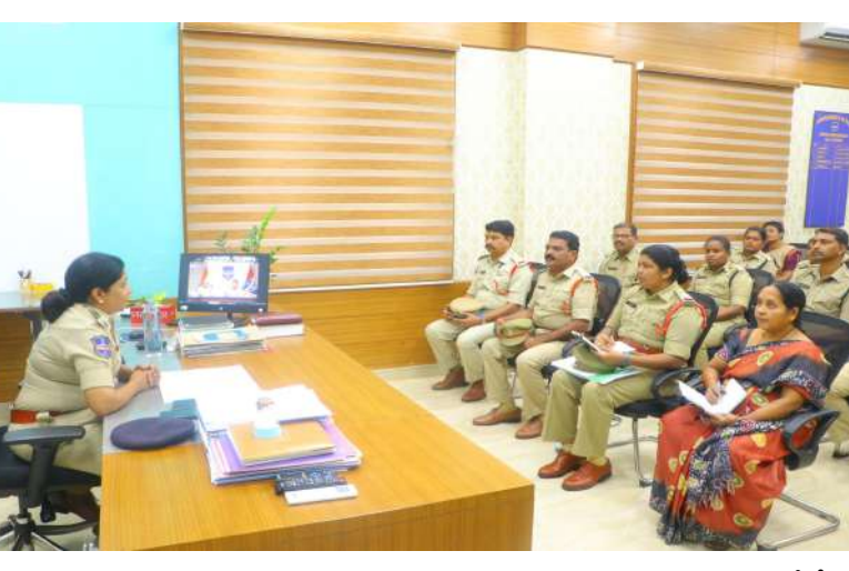
అవగాహన కార్యక్రమాల నిర్వహించాలని సూచించారు. హాట్లైన్స్ పరిసర ప్రాంతాలలో షీట్లం సిబ్బంది నెంబర్లు కాలేజీలు స్కూల్ ల వద్ద పిల్లలకు కనబడే విధంగా చిన్న చిన్న బోర్డు ఏర్పాటు చేయాలని తెలిపారు. అసాంఘిక కార్యక్రమాల నిర్వహించకుండా తగు చర్యలు తీసుకోవాలని తెలిపారు. ముఖ్యంగా దేవాలయాలు, కోమటి చెరువు, పాండవుల చెరువు, ఆక్సిజన్ పార్క్, రాజ్ పార్క్, అర్బన్ పార్క్, బస్స్టాండ్ వద్ద, స్కూల్లో కాలేజీల వద్ద ప్రత్యేక నిఘా ఉంచాలని తెలిపారు. భరోసా సెంటర్ సిబ్బంది కూడా తరచుగా షీట్లం కార్యక్రమంలో పాల్గొని మైనర్ అమ్మాయిలకు అందిస్తున్న సేవలు గురించి వివరించాలని సూచించారు. ప్రజల రక్షణకు ఎల్లవేళలా అందుబాటులో ఉండి సేవలు అందించాలని సూచించారు.