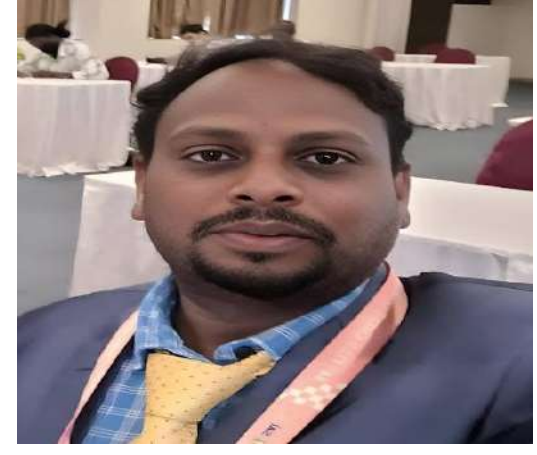
ఉన్నాయని ఇప్పటికే చాటుకున్నారు.