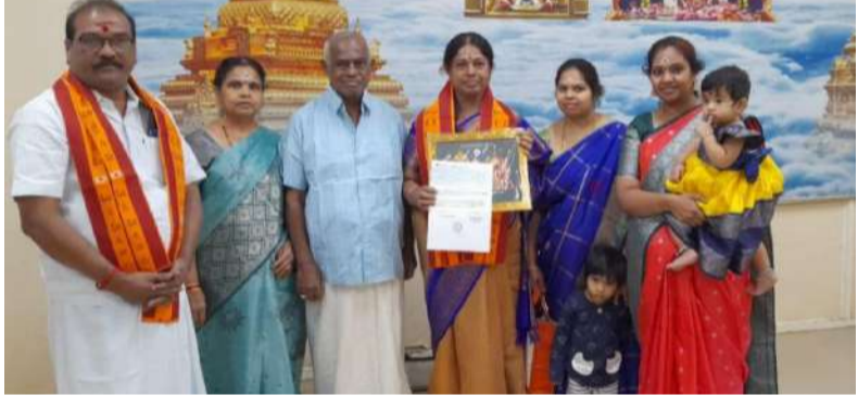
శ్రీశైలం(ప్రశ్న స్వాస్) శ్రీశైల మహాక్షేత్రంలో భక్తుల సౌకర్యార్థం శ్రీశైల దేవస్థానం నిర్వహిస్తున్న శాశ్వత అన్నప్రసాద వితరణ కు రూ.లక్ష విరాళం, హైదరాబాద్ వాస్తవ్యులు 1,00,000/-

దాతకు బాండు అందజేస్తున్న ఆలయ సహాయ కార్యనిర్వహణాధికారి జి. స్వాములు