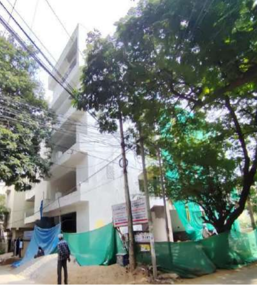
వదిలేశారంటే మర్చిపోవడం చైన్ మెన్ లకి, టౌన్ ప్లానింగ్ అధికారులకే తెలియాలి.

ఎన్నో రింజ్ అధికారులు, ఉన్నత అధికారులు చైన్ మెన్ లు ఉన్నారన్న ధీమాతో నిర్మాణ స్థలాల వద్దకి తనిఖీలకు వెళ్లడమే మానేశారని గుసగుసలు వినిపిస్తున్నాయి. చైన్ మెన్ ల ధీమాతో ఉన్నత అధికారులు బాధ్యతలు మరిచారా? లేక అవినీతి లో వాళ్ల హస్తం ఉండడంవల్ల అక్రమ నిర్మాణాలను చూసి చూడనట్లు వదిలేస్తున్నారా? అనే అనుమానాలను స్థానికులు వ్యక్తం చేస్తున్నారు. ఇటీవల కాలంలో సికింద్రాబాద్ సర్కిల్లోని లాలాపేట్ పరిధిలో ప్రధాన రహదారి కి ఎడమవైపు గా బురుజు గోడను, కమాన్ ను కూల్చివేసి ఒక నిర్మాణం యధేచ్ఛగా చేస్తున్నారు. అంతేకాదు స్టాంపు వద్ద ఎడమవైపుగా రెండవ నిర్మాణం అనుమతి తీసుకున్న దాదాపు 5 అంతస్తులు అక్రమంగా నిర్వహిస్తున్న అధికారులు చర్యలు తీసుకున్న దాఖలాలు లేవని అధికారులకు లక్షలలో ముడుపులు అందాయని స్థానికులు గుసగుసలాడుతున్నారు. అధికారులు చూసి చూడనట్లుగా నే