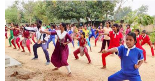
కోరారు. అనంతరం సెషన్ల ఆఫీసర్ రాణి మాట్లాడుతూ ప్రభుత్వం బాలికల ఆత్మరక్షణకోసం కరాటేలో మూడు నెలల