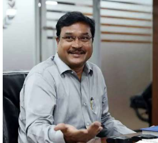
హైదరాబాద్ (ప్రశ్న స్వూస్) దేశంలో బుల్డోజర్ విధానంపై సుప్రీంకోర్టు బద్దవారం (నవంబర్ 13న) కీలక తీర్పు ఇచ్చిన

విషయం తెలిసిందే. కేవలం ఆరోపణలతోనే ఏకపక్షంగా పౌరుల ఇళ్లు కూల్చేయడం రాజ్యాంగ చట్టాన్ని అధికారాల విభజన సూత్రాన్ని ఉల్లంఘిస్తుందని నరేంద్ర మోదీ న్యాయస్థానం వివరించింది. నిందితుల ఇళ్లను బుల్డోజర్లతో కూల్చడం సరికాదని ధర్మాసనం వ్యాఖ్యానించింది. నిందితుల ఇళ్లను కూల్చే అధికారం ప్రభుత్వానికి లేదని సుప్రీం కోర్టు స్పష్టం చేసింది. సరైన విధానం పాటించకుండా ఇల్లు కూల్చడం రాజ్యాంగ విరుద్ధమని పేర్కొంది. దేశవ్యాప్తంగా బుల్డోజర్ యాక్షన్లకు సుప్రీం కోర్టు మార్గదర్శకాలు జారీ చేసింది. అయితే సుప్రీం కోర్టు ఇచ్చిన తీర్పుపై హైద్రా కమిషనర్ రంగనాథ్ స్పందించారు. కూల్చివేతలకు 15 రోజుల ముందు భవన యజమానికి తప్పనిసరిగా నోటీసులు ఇవ్వాలని రిజిస్టర్ పోస్టులో నోటీసులు పంపడంతో పాటు నిర్మాణానికి నోటీసులు అందించాలంటూ నరేంద్ర మోదీ న్యాయస్థానం ఇచ్చిన తీర్పుపై హైద్రా కమిషనర్ రంగనాథ్ కీలక వ్యాఖ్యలు చేశారు. నీటి పనరులు, రోడ్లు, ఫుల్వేతులు తదితర ప్రభుత్వ స్థలాలు అక్రమణల తొలగింపుల విషయంలో సుప్రీం కోర్టు తీర్పు వర్తించదని రంగనాథ్ చెప్పుకోవచ్చారు. జీహెచ్ఎస్ చట్టం-405