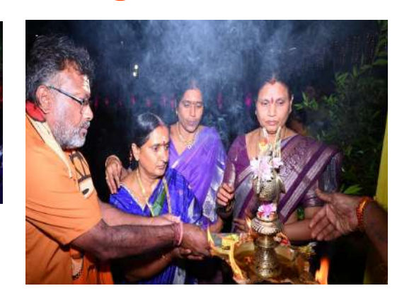
ఆరోగ్యం చేకూరుతుంది. దీర్వాయుష్న లభిస్తుంది.

6. సూర్య హారతి :ఈ సూర్య హారతిని దర్శించడం వలన