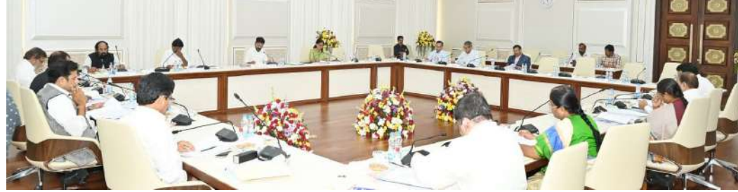
అందుకే గ్రీన్ సిగ్నల్ రాలేదని చెబుతున్నారు.

తెలంగాణ మంత్రివర్గంలో ఆరు ఖాళీలు ఉన్నాయి. మంత్రివర్గంలో ఎవరెవర్ని తీసుకోవాలన్న అంశంపై ఇప్పటికే కొన్ని పేర్లను రేవంత్ రెడ్డి హైకమాండ్ కు సమర్పించారు. అయితే ఆశావహులు చాలా ఎక్కవగా ఉండటంతో ఏ నిర్ణయం తీసుకోలేకపోతున్నారు. గత డిసెంబర్లో (ప్రభుత్వం ఏర్పడినప్పుడు పార్లమెంట్ ఎన్నికల తర్వాత ఆరు ఖాళీలను భర్తీ చేయాలని అనుకున్నారు. పార్లమెంట్ ఎన్నికల్లో అనుకున్నన్ని సీట్లు సంపాదించుకోలేకపోయారు. గతం కన్నా ఎక్కువ సీట్లే సాధించుకున్నా ఎనిమిది స్థానాలకే పరిమితమయ్యారు. అదే పలువురు సీనియర్ నేతలు హైకమాండ్ కు ఫిర్బాదు చేశారని