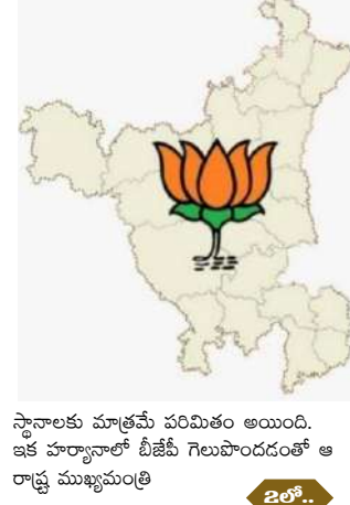
స్థానాలకు మాత్రమే పరిమితం అయింది. ఇక హర్యానాలో బీజేపీ గెలుపొందడంతో ఆ రాష్ట్ర ముఖ్యమంత్రి

పట్టం కట్టాయి. ఈ క్రమంలోనే ప్రస్తుత నాయుబ్ సింగ్ సైన్ కే మరోసారి బాధ్యతలు కట్టబెట్టాలని బీజేపీ హైకమాండ్ యోచిస్తున్నట్లు తెలుస్తోంది. హర్యానా అసెంబ్లీ ఎన్నికల్లో మ్యూజిక్ ఫిగర్ ను బీజేపీ దాటిపోయింది. ఈ నేపథ్యంలోనే ఆ రాష్ట్రంలో మరోసారి బీజేపీ అధికారంలోకి రావడం దాదాపు ఖాయం అయింది. దీంతో మరోసారి ముఖ్యమంత్రిగా నాయుబ్ సింగ్ సైన్ వైపే మొగ్గు చూపుతున్నట్లు ఆ పార్టీ వర్గాలు వెల్లడించాయి. ఇక హర్యానాలో మొత్తం 90 అసెంబ్లీ స్థానాలు ఉండగా ఇప్పటివరకు జరిగిన లెక్కింపు, వెలువడిన ఫలితాల్లో బీజేపీ మ్యూజిక్ ఫిగర్ ను దాటింది. 49 చోట్ల బీజేపీ జయతీతనం ఎగురవేయగా కాంగ్రెస్ పార్టీ 36