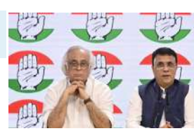
చేస్తోంది. ఈ నేపథ్యంలోనే తాజాగా మరోసారి సంచలన వ్యాఖ్యలు చేసింది. హర్యానాలో పార్టీ ఓటమి చెందడంతో

- ఫలితాలపై సంచలన ప్రకటన న్యూఢిల్లీ (ప్రశ్న స్వాస్) హర్యానాలో మొదటి అధికారంలో ఉన్న కాంగ్రెస్ పార్టీ.. ఆ వెంటనే అనూహ్యంగా వెనకబడింది. అప్పటివరకు వెనుకంజలో ఉన్న అధికార బీజేపీ.. ఒక్కసారిగా దూసుకొచ్చింది. ఈ నేపథ్యంలోనే కాంగ్రెస్ పార్టీ.. ఈ హర్యానా అసెంబ్లీ ఎన్నికల పోలింగ్, లెక్కింపుపై తీవ్ర అనుమానాలు వ్యక్తం చేస్తోంది. ఫలితాల వెల్లడి సమయంలో ఉదయం 9 గంటల నుంచి 11 గంటల మధ్య ఈసీ వెబ్ సైట్లో ఎన్నికల సంఘం అధికారులు దేటను అవేదేట్ చేయడంతో జాప్యం చేశారని ముందు నుంచి అరోపణలు చేస్తోంది. ఈ నేపథ్యంలోనే తాజాగా మరోసారి సంచలన వ్యాఖ్యలు చేసింది. హర్యానాలో పార్టీ ఓటమి చెందడంతో