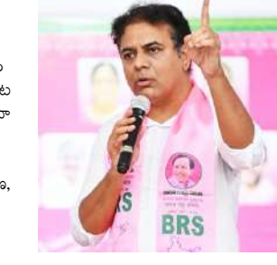
చేశారు. - కాంగ్రెస్ గ్యారంటీల గారడని నమ్మలేదు

- ఫలితాలపై కేటీఆర్ కీలక వ్యాఖ్యలు హైదరాబాద్ (ప్రశ్న స్వాస్) కర్ణాటకలో బదు గ్యారంటీలు, తెలంగాణలో ఆరు గ్యారంటీలు అంటూ అడ్డగోలు హామీలిచ్చి ప్రజలను నిలుపుగా మోసం చేసిన కాంగ్రెస్, ఏడు గ్యారంటీల పేరిట మధ్యపెట్టాలని చూసినప్పటికీ హర్యానా ప్రజలు ఆ పార్టీకి వెంటపెట్టాలంటే తీర్పునిచ్చారని కేటీఆర్ అన్నారు. హామీల అమలులే కర్ణాటక, తెలంగాణ, హిమాచల్ ప్రదేశ్ లో కాంగ్రెస్ పార్టీ ప్రభుత్వాలు చేస్తున్న మోసాన్ని దేం మొత్తం గమనిస్తోందని చెప్పడానికి ఈ ఎన్నికల ఫలితాలు నిదర్శనమన్నారు. అబద్ధపు హామీలతో అధికారం సాధించి ఆ తరువాత ప్రజలను వంచినప్పుడు కాంగ్రెస్ పార్టీకి తగిన సమయంలో ప్రజలు బుద్ధి చెబుతారని తాము మొదటి నుంచి చెబుతూనే ఉన్నామని గుర్తు