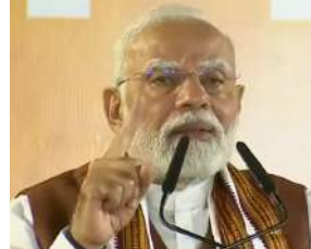
అభినందించారు. గతంలో ఎప్పుడు లేని విధంగా జమ్మూ కాశ్మీర్ లో ఈసారి

- ఎన్నికల ఫలితాలపై ప్రధాని మోదీ న్యూఢిల్లీ (ప్రశ్న స్వాస్) హర్యానా ప్రజలు బీజేపీకి హ్యట్రిక్ విజయం అందించడంపై ప్రధాని నరేంద్ర మోదీ హర్షం వ్యక్తం చేశారు. భగవద్దీత పుట్టినవారే బీజేపీ మరోసారి విజయం సాధించినందుకు చెప్పారు. తమపై విశ్వాసం ఉంచిన ప్రజలకు ప్రధాని మోదీ ధన్యవాదాలు తెలిపారు. హర్యానా, జమ్మూ కాశ్మీర్ అసెంబ్లీ ఎన్నికల ఫలితాలపై బీజేపీ శ్రేణులను ఉద్దేశించి ఢిల్లీలో మోదీ ప్రసంగించారు. ప్రస్తుతం నవరాత్రులు జరుగుతున్నాయి. అమ్మవారి ఆశీర్వాదంతో బీజేపీ హర్యానాలో గెలిచిందన్నారు. జమ్మూ కాశ్మీర్ ఎన్నికల్లో విజయం సాధించిన కాంగ్రెస్, నేషనల్ కాన్ఫెడరేషన్ కూటమిని ప్రధాని మోదీ