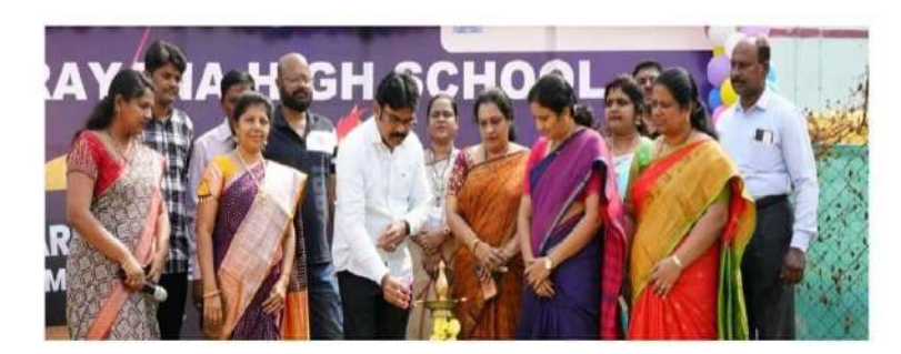
కూకట్ పల్లి (ప్రశ్న మ్యాస్) విద్యార్థుల్లో దాగి ఉన్న ప్రతిభను వెలికి తీసేందుకు కూకట్ పల్లి జోన్ నారాయణ పాఠశాలల యాజమాన్యం ప్రాథమిక స్థాయిలో విద్యార్థులకు మంగళవారం ఆటల