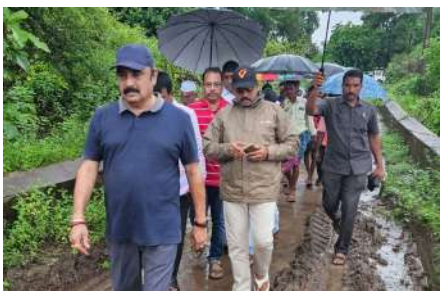
పోలవరం (ప్రత్న న్యాస్) వెలీరపాదు మండల ముంపు భ్రభావిత (పొంతాలను పోలవరం శానసరభ్యలు 20 జాలరాజు పర్యదించారు ఈ కార్యక్రమంలో కట్టూరు కోయిదా పంచాయతీలలో పేరంటాలపల్లి టేకుపల్లి (గామాల్లో లాంచి ప్రయాణం ద్వారా నేరుగా ముంపు (గామాలను సందర్భంచాలపల్లియేల్ల, కందివప్పు పంచదాళ ఉల్లిపాయలబంగాళాదుంబలు, మందినూని నిత్యాపసర సరకులను ప్రజలకు సరఫరా రెయ్యదం జరిగింది ఎస్పడా లేని విధంగా కూటమీ పథుత్వం సదుస్తుందిని, ప్రజలివస్తరు భయ్యాంతులకు గరవ్పొద్దని మీకు అందగా మేము ఉంటాము అని పోలపరం శాసనరభర్తు 20 జాలరాజు హామీ ఇషరం సం వరిగింది ఈ కార్యక్రమంలో జిల్లా కార్యదర్శి గ్రామం రాజుయ్యాలా చిల్లా చిరితా ఉంది. జరిగింది ఈ కార్యక్రమంలో జిల్లా కార్యదర్శి గద్ధముగు దిరి కుమార్ దీ డి డి దబ్బు ఏ ఎం రాము అద్దయ్య ఆర్ ఏ జే యు డి ఎల్ పి ఓ హాస్మాతుళ్ళ, ఎం పి డి ఓ ఎమ్మార్స్ డివి చైలస్పదొర ఈ ఓ పి ఆర్ ఆర్ డి సి. సెక్రటరీ మందల జనసేన అధ్యక్షులు గణిసుల అదినారాయణ కూటమి రాయకులు పాల్గొన్నారు