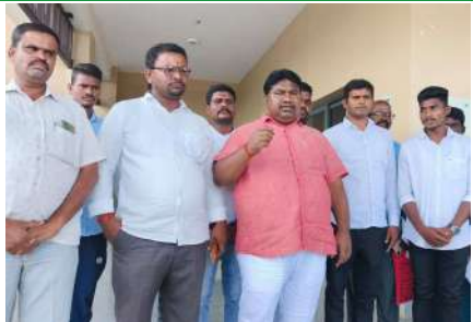
జిల్లాలో తీవ్ర చర్యనీయాంశమేదని, ఈ ఘటనపై త్వరితగతిన విచారణ జరిపి బాధ్యులపై చర్యలు తీసుకోవాలని కోరారు. ఈ