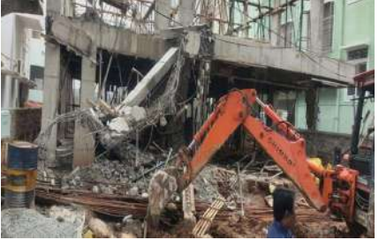
జేబుల్లోకి పోతే మూసీ కంపు బారినపడి హైదరాబాద్ ప్రజలు రోగాలతో అనుభవించే పాలవుతున్నారని అన్నారు.

మూసీ సుందరీకరణ పెద్ద బోగస్, గత 30 ఏళ్ల నుండి ఈ మాటలు వింటూనే ఉన్నామన్నారు. మూసీ ప్రక్షాళన పేరుతో ఒకసారి జపాన్ నిధులు తెచ్చారని, ఇంకొకసారి జపాన్ నిధులు ఖర్చు చేశారని, ఒకాయన ఏకంగా హుస్సేన్ సాగర్ ను కాల్చివేస్తే మారుస్తానన్నాడని బండి సంజయ్ ఎద్దేవా చేశారు. తెచ్చిన నిధులు మాత్రం కాంగ్రెస్, బీఆర్ఎస్ నేతల