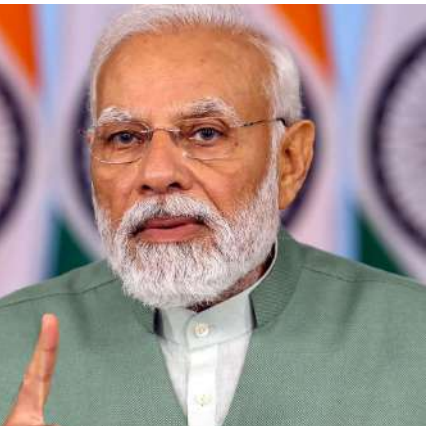
అనెంబ్లీ ఎన్నికల తుది (మూడవ) విడత పోలింగ్ జరుగుతుంది. అక్టోబర్ 8న ఫలితాలు వెలువడతాయి.

జమ్మూకశ్మీర్లోని కాంగ్రెస్, ఎన్సీ, పీడీపీల 'మూడు కుటుంబాల' పాలనతో ప్రజలు విసిగిపోయారని, ప్రజలు శాంతిని కోరుకుంటున్నారని ప్రధాని అన్నారు. అవినీతి, ఉద్యోగాల్లో వివక్ష తిరిగి చోటుచేసుకోరాదని, వేర్పాటువాదం, రక్తపాతానికి ఇంకెంత మాత్రం చోటులేదని ప్రజలు భావిస్తున్నారని పేర్కొన్నారు. ఇక్కడి ప్రజలు శాంతిని కోరుకుంటున్నారు. తమ పిల్లలకు మంచి భవిష్యత్తును ఆశిస్తున్నాను. ఆ కారణంగానే జమ్మూకశ్మీర్ ప్రజలు బీజేపీ పాలన రావాలని కోరుకుంటున్నారని అని మోడీ అన్నారు. 2016 సెప్టెంబర్ 18న భారత్ చేపట్టిన సర్దికల్ దాడులను ప్రధాని గుర్తుచేస్తూ, రేపంపా ఉగ్రవాదంపై సర్దికల్ దాడులతో ప్రపంచానికి తాము విస్పష్టమైన సందేశం ఇచ్చామని, ఇది న్యూ ఇండియా అని, ఉగ్రవాదాన్ని సహించేది లేదని చాలా స్పష్టంగా తెలియజేశామని అన్నారు. ఉగ్రవాదులు తెగబడితే వారక్కడున్నా మోడీ వెతికి పట్టుకుంటారనే విషయం వారికి బాగా తెలుసున్నారని, కాంగ్రెస్ పార్టీ మాత్రం సర్దికల్ దాడులకు ఆధారాలు చూపెట్టమని ఆర్టీవి నిలదీస్తోందని ప్రధాని విమర్శించారు. కాగా, అక్టోబర్ 1న జమ్మూకశ్మీర్