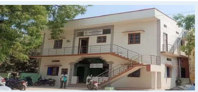
ఏడు మంది డీ ఈ లు 37 మంది ఏఈలు 85 మంది జూనియర్ అసిస్టెంట్లు బదిలీ అయ్యారు