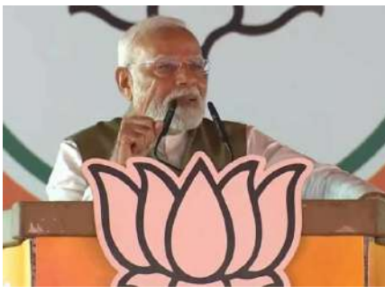
గణపతి బహుమతి జరిగిన అనంతపురం మహారాష్ట్ర కాంగ్రెస్ నేతలు మాట్లాడుతూ లేదని విమర్శించారు. కాంగ్రెస్ అంటేనే అబద్ధాలు అని, మహారాష్ట్ర ప్రజలు అప్రమత్తంగా ఉండాలన్నారు. రైతులను నాశనం చేసిన కాంగ్రెస్ పార్టీకి మరో అవకాశం ఇవ్వకూడదన్నారు.

దెయ్యం పూసుకుందన్నారు. నేటి కాంగ్రెస్ పార్టీలో దేశభక్తి అనే భావనే లేదన్నారు. కాంగ్రెస్ నేతలు యాంటీ ఇండియా ఎజెండాను కొనసాగిస్తున్నారని మండిపడ్డారు. రిజర్వేషన్ వ్యవస్థపై అమెరికాలో వ్యాఖ్యలు చేసిన ఆ పార్టీ నేతను సొంత పార్టీ నాయకులే తప్పుపడుతున్నారన్నారు. అవినీతిమయమైన పార్టీ ఏదైనా ఉందంటే, అది కాంగ్రెస్ పార్టీయే అన్నారు. ఆ పార్టీ కుటుంబ సభ్యులే పెద్ద అవినీతిపరులు అని విమర్శించారు. కాంగ్రెస్ పార్టీ గణపతి పూజను కూడా ద్వేషిస్తోందన్నారు. గణపతి పూజకు వెళ్లే రాజకీయాలు ఆపాదించడం ఏమిటని ఆగ్రహం వ్యక్తం చేశారు. కర్ణాటకలో గణపతి బహుమతి జైల్లో వేశారని, ఓ లీగ్ హాస్పిట్ పోలీస్ వ్యాన్లో పెట్టారని ద్వేషమెశారు.