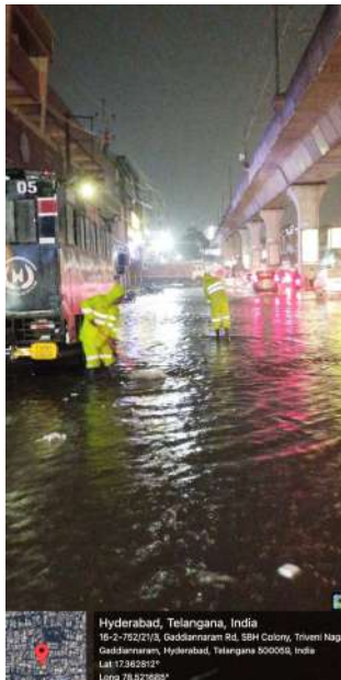
Hyderabad, Telangana, India 16-2-752/2/1, Gaddannam Rd, 5th Colony, Tivoli Nagar Gaddannam, Hyderabad, Telangana 500082, India 16-2-752/2/1 16-2-752/2/1

ఒక్కసారిగా కురిసిన భారీ వర్షంతో రోడ్లపై ఉన్న వాహనదారులు తీవ్ర ఇబ్బందులు పడ్డారు. రాత్రి సమయం కావడంతో రోడ్లపై పెద్దగా వాహనాల రాకపోకలు లేకపోవడంతో పెద్దగా ట్రాఫిక్ సమస్యలు ఏర్పడకపోవడం గమనార్హం. మరోవైపు కుమ్మరించిన వర్షంతో డ్రైనేజీలు పొంగిపొర్లుతున్నాయి. పలు ప్రాంతాల్లో విద్యుత్ సరఫరాలో అంతరాయం ఏర్పడింది. కుండపోత వర్షంతో బస్సులు, లోతట్టు ప్రాంతాల్లోని కాలనీలు మళ్లీ జలమయం అయ్యాయి. ఆయా ప్రాంతాల్లోని స్థానికులు తీవ్ర ఇబ్బందులు పడ్డారు. రాత్రి సమయంలో ఇలాంటి భారీ వర్షం కురియటంతో.. జీహెచ్ఎస్ అధికారులు అప్రమత్తమయ్యారు. భారీ వర్షాల దృష్ట్యా నగరవాసులు ఇండ్ల నుంచి బయటకు రావద్దని, అత్యవసరమైతేనే రావాలని హెచ్చరించారు. పిదగులు పడే అవకాశం కూడా ఉందని అధికారులు హెచ్చరించారు. వర్షం వూర్తిగా ఆగిపోయే వరకు సురక్షిత ప్రాంతాల్లో ఉండాలని జీహెచ్ఎస్ అధికారులు సూచించారు. అయితే మరో మూడు రోజుల వరకు భారీ వర్షాలు ఉన్నట్లు వాతావరణ శాఖ హెచ్చరికలు చేసింది. హైదరాబాద్ నగరంలో పాటు తెలంగాణ వ్యాప్తంగా ఆయా జిల్లాల్లో భారీ