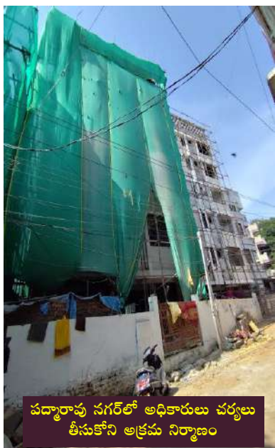
కథనం రావడం జరిగింది. అక్రమ బిల్లర్లుగా వ్యవహరించే గుండాలకు కోపం