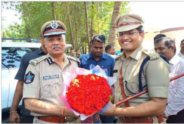
మధ్యకాలంలో నూజివీడు రూరల్ మండలం పల్లెరముడి గ్రామంలో ఒక మైనర్ బాలికపై జరిగిన అత్యాచారాన్ని పురస్కరించుకొని 48 గంటల లోపు ముద్దాయిని అరెస్టు చేసి ముద్దాయిని రిమాండ్ ఏలూరు జిల్లా పోలీస్ సిబ్బంది పంపించారని అన్నారు.