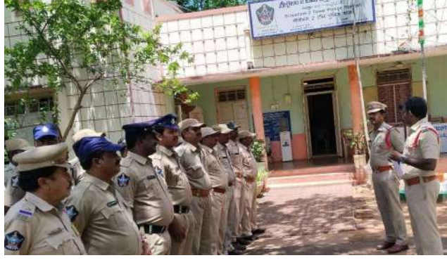
పోలీసులు చర్యలు తీసుకున్నారు.