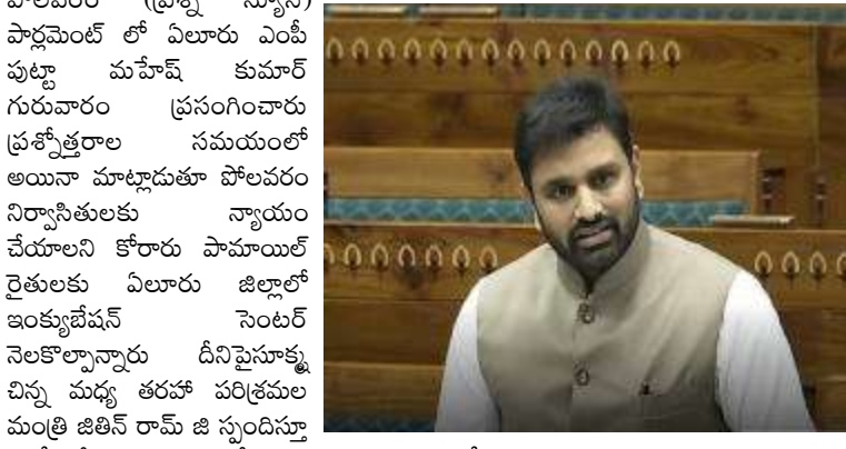
న్యాయం చేయాలని కోరారు పామాయిల్ రైతులకు ఏలూరు జిల్లాలో ఇంక్యుబేషన్ సెంటర్ నెలకొల్పామని డి.వి.సూర్యు చిన్న మధ్య తరహా పరిశ్రమల మంత్రి జిబిన్ రామ్ జి స్పందిస్తూ ఎంపీ కోరిన వాటిని పరిశీలిస్తామని చెప్పినట్లు ఎంపీ కార్యాలయ పర్గాలు తెలిపాయి