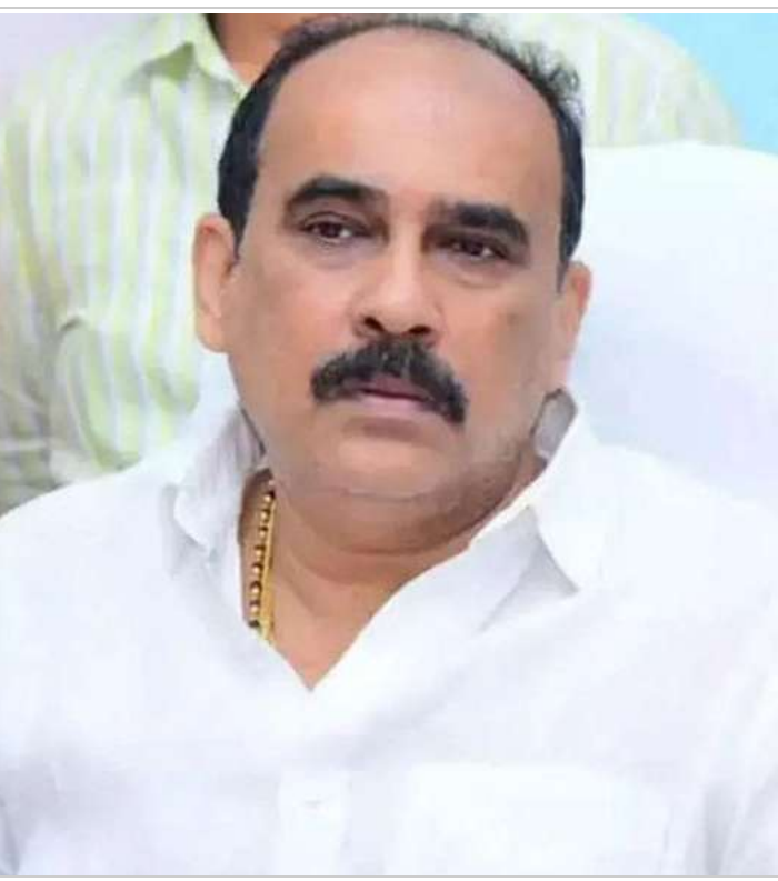
అదే జరిగితే మద్దంతర ఎన్నికలు రావచ్చనే అనుమానాలు వ్యక్తమవుతున్న విశేషాలు.

చేయిస్తారు. ఆ పోలింగ్ బూత్ లలో ఓటర్లతో రీ వెరిఫికేషన్ పోలింగ్ ఆయా పోలింగ్ బూత్ లో వాటిని ఈవిఎంలను వివిధ ప్యాట్లను తెప్పించి సాధారణ పోలింగ్ మాదిరిగానే ఓటర్ల చేత ఓట్లు వేయిస్తారు. అభ్యర్థుల సమక్షంలోనే ఇలా చేస్తారు. ఓటు వేశాక అదే గుర్తుపైన సమాధిపూతగా లేదా వేరే పార్టీ గుర్తుపై సమాధిపూతగా అనేది అక్కడే పరిశీలిస్తారు. ఇక ఎన్నికల సంఘం ఆదేశాల మేరకు ప్రకాశం జిల్లా కలెక్టర్ తమిమ్ అన్నారాయా ప్రత్యేక శిక్షణ కూడా తీసుకున్నారు. జెల్ కంపెనీకి చెందిన నిపుణుల సమక్షంలో ఈ ప్రక్రియ జరుగుతుందని 19వ తేదీ నుంచి రోజువారీ రెండు బూత్ లలో ఓటర్లతో ఓట్లు వేయించి రీ వెరిఫికేషన్ పోలింగ్ చేస్తారని చెబుతున్నారు. మొత్తం 12 బూత్ లలో రీ వెరిఫికేషన్ జరుగుతుంది. దీంతో ఒంగోలు వ్యాప్తంగా ఉత్కంఠ కొనసాగుతోంది. ఈ ప్రక్రియతో ఈవిఎంలపై ఉన్న అనుమానాలు విశ్రాంతి పొందాయని ఈసీ అంటుండగా హ్యాకింగ్ విషయంపై క్లారిటీ వస్తుందని వైసీపీ నేతలు చెబుతున్నారు. ఒకవేళ ఈవిఎంల హ్యాకింగ్ గురయ్యాయని తెలితే ఏపీలో ఎన్ డిఐ ప్రభుత్వానికి ఎదురుదెబ్బ తగితే అవకాశాలు ఉన్నాయి. ఈవిఎంలపై అదే జరిగితే మద్దంతర ఎన్నికలు రావచ్చనే అనుమానాలు రాష్ట్రమంతటా రీ వెరిఫికేషన్ చేయాలనే డిమాండ్ పెరుగుతుంది. వ్యక్తమవుతున్న విశేషాలు.