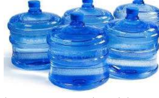
నీరు నిశ్చ, అత్యవసరం నిద్ర లేస్తుండగానే నీటి అవసరం వుంటుంది. పడుతుంది. ఆ నీటినే వ్యాపార వస్తుగా మార్చి కొందరు అక్రమాలకు పాల్పడుతున్నారు. మినరల్ వాటర్

పేరుతో ఏమాత్రం శుద్ధి చేయనినీటిని క్యాన్సర్ నింపి ప్రజలకు అందిస్తున్నారు. బోరునీటిని విక్రయిస్తూ నిలుపునూ దోచుకుంటున్నాయి. ఇంత జరుగుతున్నా అధికారులు నోరుమెదవకుండా మిస్సుకుండిపోవడంపై విమర్శలు వెల్లువెత్తుతున్నాయి. మినరల్ వాటర్ వ్యాపారులకు కాసులు కురిపిస్తున్నాయి. కొంత మంది వ్యాపారులు ప్రజల అవసరాలను దృష్టిలో ఉంచుకుని మినరల్ వాటర్ వ్యాపారం చేయాలని కోరాలిగా దోపిడి చేసేస్తున్నారు. మారుతున్న కాలానికి అనుగుణంగా మంచినీరు కూడా కలుపితం అయిపోతున్నది. దీంతో హైదరాబాద్ మహానగరంలో పలు ప్రాంతాలలో పాటు పల్లెవాసులు కూడా అత్యధిక శాతం శుద్ధి జలాలపై ఆధారపడాలి వస్తోంది. రాష్ట్ర వ్యాప్తంగా 90 శాతం మందికి పైగా ప్రజలు మినరల్ వాటర్ నే ఉపయోగిస్తున్నారంటే రాష్ట్రంలో మినరల్ వాడకం ఏ స్థాయిలో పెరిగిందో స్పష్టంగా అర్థమవుతుంది. దీనిని దృష్టిలో ఉంచుకుని కొంతమంది తక్కువ పెట్టుబడితో నాణ్యత లేని మినరల్ వాటర్ ఫ్లాంట్లను ఏర్పాటు చేసి నిబంధనలకు విరుద్ధంగా భూగర్భజలాలను తోడేస్తున్నారు. అవే జలాలకు మినరల్ వాటర్ పేరు తోడిగి వాటికి ధర నిర్ణయించి ప్రజలకు విక్రయిస్తున్నారు. దీంతో కొన్ని ప్రాంతాల్లో నాణ్యత లేని జలాలను ఉపయోగిస్తున్న ప్రజలు కొన్ని సందర్భాల్లో విలువైన ఆరోగ్యాలను కోల్పోవాల్సి వస్తోంది. ప్రత్యేకంగా మినరల్ వాటర్ అమ్మకాలు రెండింతలు పెరగడంతో ఆయా ప్రాంతాల్లో మరెన్ని ఫ్లాంట్లను ఏర్పాటు చేసి బోగెస్ కంపెనీల పేరుతో వాటర్ బాటిల్స్ ను స్వయంగా అందించి ట్రాంపెడ్ కంపెనీల మినరల్ వాటర్ల అమ్మకాలు సాగిస్తున్నారు. ముఖ్యంగా హైదరాబాద్, సికింద్రాబాద్, కూకట్ పల్లి రైల్వేస్టేషన్లు, బస్సాండ్లు, హైటెక్ లో అత్యధిక శాతం గుర్తింపు లేని కంపెనీ మినరల్ వాటర్ నే సరఫరా చేస్తున్నారంటే