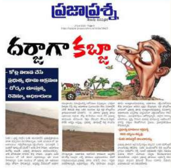
బల్లువోలు గ్రామస్థులు, వ్రజా ప్రతినిధులు, అభినందించారు. ఈ సందర్భంగా విఆర్.ఎ. మస్సానయ్యను మాట్లాడుతూ ఇది ప్రభుత్వ భూమి దీంట్లో ప్రవేశించిన అక్రమించిన కర్ర చర్యలు తప్పవని క్రిమినల్ కేసులు నమోదు చేస్తామని ఆయన తెలిపారు.

భారీ స్పందన వచ్చింది. "వ్రజా వ్రశ్య తెలుగు జాతీయ దినపత్రిక" రాసిన ఓ కథనం ప్రభుత్వ భూమి అన్యాయం కాకుండా కాపాడగలిగింది. "వ్రజా వ్రశ్య" తెలుగు జాతీయ దినపత్రిక రాసిన కథనంపై ఓజిలి తాసిల్దార్ నాంచారయ్య వెంటనే స్పందించి రూ.కోట్ల రూపాయలు విలువైన భూమి ప్రభుత్వం చేజారకుండా ఆపగలిగారు. ఓజిలి మండలం లోని కర్ర బొల్లువోలు గ్రామపంచాయతీ పరిధిలోని 15 ఎకరాల అక్రమణకు గురైన అంశంపై "వ్రజా వ్రశ్య" జాతీయ తెలుగు దినపత్రిక " మెయిన్ టో" వచ్చిన "దర్జాగా కబ్బా? అనే శీర్షికన వచ్చిన కథనానికి అధికారులు స్పందించారు. దీనిపై స్పందించిన ఓజిలి తాసిల్దార్ నాంచారయ్య విచారణకు ఆదేశించారు. దీంతో అధికారులు రంగంలోకి దిగారు. ఓజిలి మండలం లోని కర్ర బల్లువోలు సమీపాన గల సర్వే నంబర్ గల భూమి అక్రమణకు గురైనట్లు రెవెన్యూ అధికారులు నిర్ధారించారు. వీలెన్నో మస్సానయ్య రెవెన్యూ సిబ్బందితో కలిసి భూమిలో హెచ్చరికపేర్లు ఏర్పాటు చేశారు. దీంతో మండల ప్రజలు వ్రజా వ్రశ్య తెలుగు జాతీయ దినపత్రిక ను ప్రత్యేకంగా అభినందించారు. నిజాయితీగా నికచ్చిగా వార్తలు రాయడం "వ్రజా వ్రశ్య" దినపత్రిక వల్లే సాధ్యమవుతుందని పత్రిక యాజమాన్యాన్ని అభినందించారు. కోట్ల రూపాయలు విలువ చేసే ప్రభుత్వ భూమిలను కాపాడడంలో తాసిల్దార్ నాంచారయ్య ను విఆర్.ఎ. మస్సానయ్యను ప్రత్యేకంగా మండల ప్రజలు, కర్ర