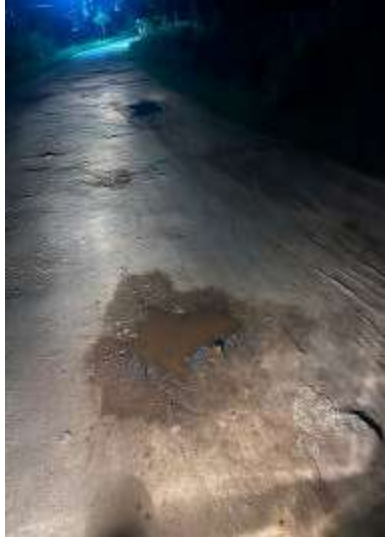
మంత్రి కోమటిరెడ్డి వెంకటరెడ్డిని తలచుకుంటామని పల్లె వాసులు రైతులు వేయించాలని గ్రామస్థులు గట్టిగా కోరుతున్నారు. తమ గ్రామానికి సీసీ రోడ్డు వేస్తే ప్రజా ప్రభుత్వానికి రుణ పడి ఉంటామని,