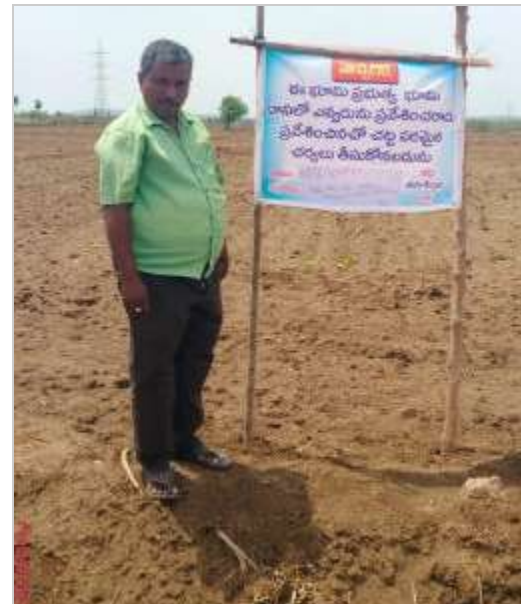
ఓజిలి ( ప్రశ్న స్వాస్) బాధ్యతాయుతమైన జర్నలిజంతో "వ్రజా వ్రశ్య" తెలుగు జాతీయ దినపత్రిక ప్రచురించిన ఓ కథనానికి