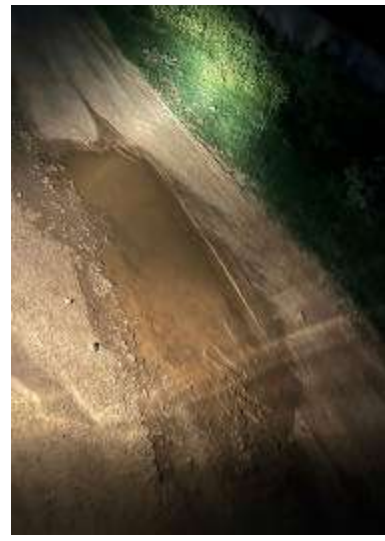
బైపాస్ నుండి పట్టంపల్లికి వెళ్లే దారి సుమారు మూడు కిలోమీటర్ల దూరం కు వెళ్లే దారి ఒక రైతుకు ప్రమాదం జరిగిన గర్భిణి స్త్రీకి ప్రమాదం జరిగిన అంబులెన్స్ రావడానికి అయినా సరకయాతన అనుభవిస్తున్న మా