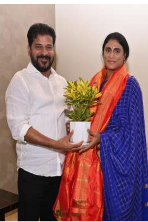
జయంతి కార్యక్రమానికి వెళ్లకుండా చేయాలని అనుకుంటున్నారు. కానీ కొంత మంది నేతలు మాత్రం కాంగ్రెస్ వైపు చూస్తున్నారని వారు వెళ్లి అవకాశం ఉందన్న గుసగుసలు వినిపిస్తున్నాయి. వైఎస్ అగ్రనేతలు కూడా పోటీగా వైఎస్ జయంతి కార్యక్రమం నిర్వహించే అవకాశాలు ఉన్నాయి.

వినయోగింపచుకునేందుకు ఈ కార్యక్రమాన్ని ఉపయోగించుకునే అవకాశం ఉంది. వైఎస్ లోని వైఎస్ ఆత్మంత ఆత్మీయులకు కూడా అవకాశాలు పంపుతున్నట్లుగా తెలుస్తోంది. వైఎస్ రాజశేఖర్ రెడ్డి అసలైన వారసురాలిగా ప్రజల్లో గుర్తింపు పొందేందుకు షర్మీల ప్రయత్నిస్తున్నారు. ఈ క్రమంలో వైఎస్ జయంతిని ఘనంగా నిర్వహించడాన్ని టాస్క్ గా తీసుకున్నారు. అదే సమయంలో వైఎస్ నేతలు వైఎస్ జయంతి కోసం ఎలాంటి ఏర్పాట్లు చేయడం లేదు. ఓటమి భారంలో ఉన్న నవరూ.. వైఎస్ జయంతి వేడుకలు నిర్వహించే పరిస్థితుల్లో లేదు. - ఏ కార్యక్రమం నిర్వహించే స్థితిలో లేని వైఎస్ అయితే ఇప్పుడు షర్మీల ఘనంగా వైఎస్ జయంతిని వ్యూహాత్మకంగా నిర్వహిస్తున్నారని వారు వెళ్లి ఆసక్తికలిపే వైఎస్ అభిమానాలకా కాంగ్రెస్ వైపు వెళ్లిపోవాలన్న అందోళన వైఎస్ లో వ్యక్తమవుతోంది. అందుకే తమ పార్టీ నేతల్ని వైఎస్