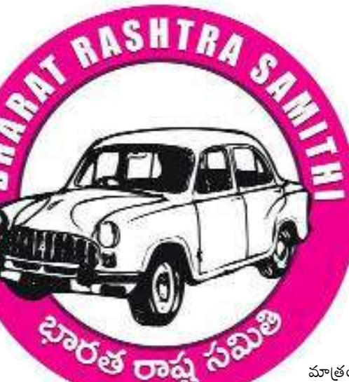
భారత సమితి మాత్రం.. ఏడు మండలాలను వెనక్కి తీసుకోవాలి చర్చించాలని.. అదే పెద్ద విభజన సమస్య అని అంటోంది.

పురుషోత్తమ పట్నం, ఎటపాక, గుండాల, కన్యాయగూడెంలను తిరిగి తెలంగాణలో కలపాలన్న డిమాండ్ ఉంది. ఏపీలో ఏడు మండలాల కలపాల్సి వచ్చినప్పుడు భద్రాచలం అలయ ప్రాంతాన్ని తెలంగాణకు వదిలేసి, మిగతా మండలం మొత్తం ఆంధ్రాకు కేటాయించాలి అని చట్టం చేశారు. ఇక్కడ ఒక సాంకేతిక సమస్య ఏమంటే భద్రాచలం పట్టణం మొత్తం అనంట్, కేవలం భద్రాచలం పట్టణం మాత్రమేనన్న సాంకేతిక పదజాలంలో తెలంగాణకు భద్రాచలం మాత్రమే ఇచ్చి, భద్రాచలంలోని పంచాయతీలు ముఖ్యంగా, తెలంగాణ ప్రాంతంలో ఉన్న ఎటపాక, పిచ్చికలపాడు, కన్యాయగూడెం, భద్రాచలం నెత్తి ఉన్న పురుషోత్తమపట్నం, దానికి ఆనుకొని ఉన్న గుండాల గ్రామాలను ఆంధ్రప్రదేశ్ రాష్ట్రానికి కేటాయించారు. ఈ ఐదు పంచాయతీలు భద్రాచలం పట్టణంలో అంతర్భాగం. గోదావరికి భారీ వరద వస్తే భద్రాచలం పట్టణానికి వరద ముప్పు ఉంటుంది. ఆ ఐదు గ్రామాలను తెలంగాణకు కేటాయస్తే ఆయా ఊర్ల నుంచి కరకట్ట నిర్మించి గోదావరి వరదల నుంచి భద్రాచలం పట్టణానికి శాశ్వతంగా రక్షణ కల్పించాలని ప్రభుత్వం ఛావిస్తున్నది. అందుకే ఈ ఐదు గ్రామాలను తెలంగాణలో కలిపేలా ఏపీ ప్రభుత్వంతో మాట్లాడుతామని కాంగ్రెస్ పార్టీ చెబుతోంది. మేనేజ్మెంట్ నూ పెట్టండి. అయితే బీఆర్ఎస్