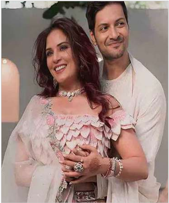
అలీ ఘజల్ మీర్జాపూర్ సీజన్3 తో డ్రెమండ్ బజార్ అనే వెబ్ సీరీస్లో హీల్ ప్రేక్షకుల ముందుకు వచ్చాడు.

మీర్జాపూర్ ఫేమ్, బాలీవుడ్ నటుడు అలీ ఘజల్ తండ్రి అయ్యాడు. ఆయన సతీమణి బాలీవుడ్ నటి రిచా చద్దా పండంటి బిడ్డకు జన్మనిచ్చింది. ఈ విషయాన్ని అలీ ఘజల్ - రిచా దంపతులు సోషల్ మీడియా వేదికగా వెల్లడించారు. బాలీవుడ్లో వచ్చిన ఫటల్ సినీమాలో కలిసి నటించారు రిచా చద్దా, అలీ ఘజల్. ఈ సినీమా అనంతరం వీరి స్నేహం ప్రేమగా మారింది. దాదాపు 9 ఏళ్లపాటు రెండింటిలో ఉన్న వీరిద్దరు 2021లో రిజిస్టర్డ్ మ్యారేజీ చేసుకున్నారు. అయితే వీరిద్దరు పెళ్లి చేసుకున్నట్లు ఎక్కడ అనాన్సు చేయలేదు. ఇక కోవిడ్ అనంతరం 2023లో తాము రిలీజ్లో ఉన్నామని అధికారికంగా ప్రకటించి మరోసారి గ్రాండ్గా పెళ్లి చేసుకున్నారు. పెళ్లి అనంతరం ఈ ఏడాది ఫిబ్రవరిలో తాను ప్రెగ్నెంట్ అని వెల్లడించిన రిచా తాజాగా జూలై 16న కుమార్తె జన్మించినట్లు వెల్లడించింది. ఇక రిచా రీసెంట్గా హీరామంది ది అందుకోగా.. అలీ ఘజల్ మీర్జాపూర్ సీజన్3 తో డ్రెమండ్ బజార్ అనే వెబ్ సీరీస్లో హీల్ ప్రేక్షకుల ముందుకు వచ్చాడు.