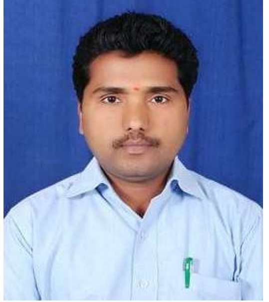
ఫార్మసిస్ట్ ల సంఘాల డిమాండ్ చేస్తున్నాయి. ఈ మధ్యనే తెలంగాణ రాష్ట్ర ఫార్మసి కౌన్సిల్ లో డిప్యూటీ ఫార్మసి విద్య