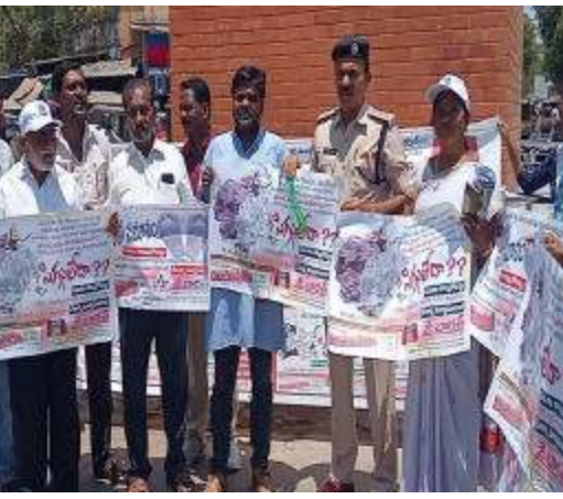
చేస్తున్నారు. ముఖ్యంగా డీసీ, ఎస్సీ, ఎస్టీల్లో ఇప్పటికీ ఇంకా కనీసం చట్టసభల్లో ప్రాతినిధ్యం లేకుండా ఎన్నో ఉప కులాలు ఇంకా నాగరిక సమాజానికి దూరంగా దుర్భరంగా జీవిస్తున్నారు. ఇది ప్రజా స్వామ్యానికి ముప్పు, ఇలాంటి పరిస్థితి మారాలి అంటే ఎన్నికల్లో స్పష్టంగా, స్వేచ్ఛగా ఓటు వేయాలి. దబ్బలకి, మద్దానికీ లొంగి పోవద్దు. ఓటు అనేది మన జీవితం ఎంతో విలువైనది అని గ్రహించాలని కోరారు.