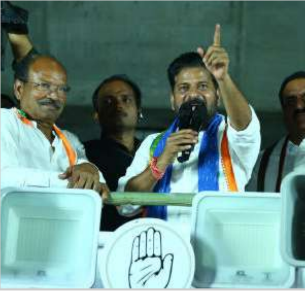
వ్యాఖ్యానించారు. తనను తిడితే మోడీకి ఏం వస్తుందని ప్రశ్నించారు. తెలంగాణకు మోడీ ఏమిస్తారో ఒక్క మాట కూడా చెప్పలేదన్నారు. మోడీని గద్దె దించే వరకు కాంగ్రెస్ కార్యకర్తలు నిర్ణయించబోరని అన్నారు.

12 ఎంపీ సీట్లు గెలిస్తే నామినేషన్లకు కేంద్రమంత్రి అవుతారని కేసీఆర్ చెబుతున్నారని మండిపడ్డారు. ఎవరి చెవిలో పువ్వు పెడతారు? ఇండియా కూటమి నేతలు.. కారును దగ్గరకు కూడా రానియరని రేవంత్ తేల్చి చెప్పారు. తెలంగాణలో 14 ఎంపీ సీట్లు గెలిచి.. రాహుల్ గాంధీని ప్రధానిని చేయబోతున్నామని చెప్పుకొచ్చారు. కేసీఆర్ జీవితంలో సీఎం పదవి అనేది ఇక లేదు. సబితా ఇంద్రా రెడ్డి ఉదయం కారు గుర్తు అంటున్నారు.. సాయంత్రం కమలం గుర్తు అంటున్నారని రేవంత్ ఎద్దేవా చేశారు. హైదరాబాద్ కు బీజేపీ అసెంబ్లీ ప్రధాని మోదీ రద్దు చేస్తే కొండా విశ్వేశ్వర్ రెడ్డి ఎందుకు ప్రశ్నించలేదని రేవంత్ నిలదీశారు. విశ్వేశ్వర్ రెడ్డి రాజ్యసభకు వెళితే మంచిదని పొతప్ప పలికారు. జమాబాద్ లో కేసీఆర్ ప్రసంగాన్ని మోదీ కాపీ కొట్టారు తప్ప కొత్తదనం ఏమీ లేదని రేవంత్ రెడ్డి