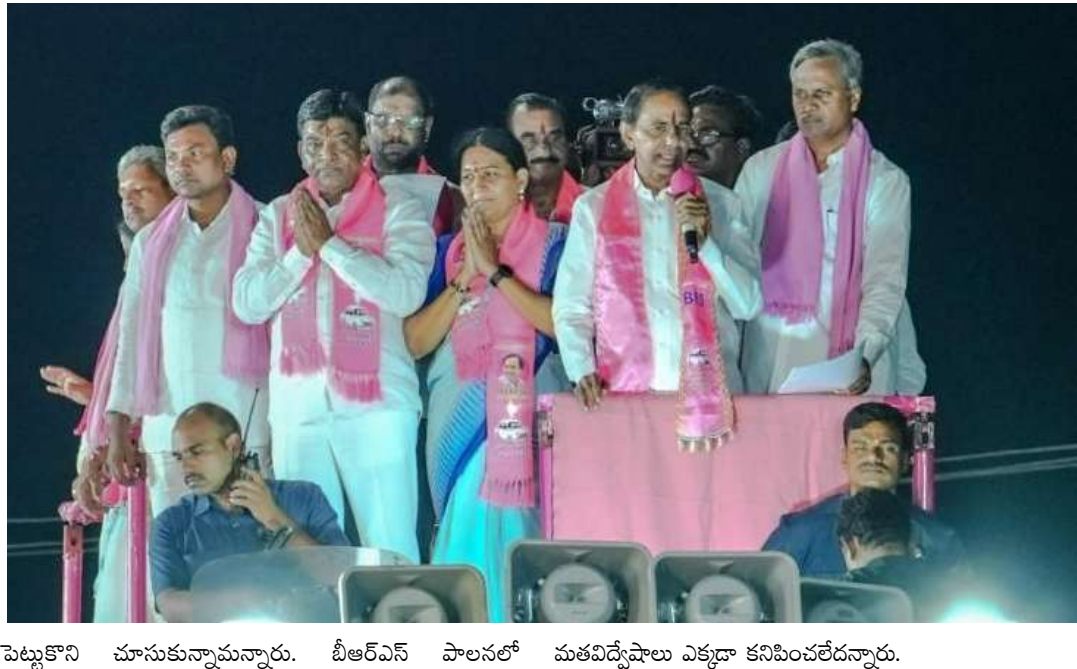
పెట్టుకొని చూసుకున్నామన్నారు. బీఆర్ఎస్ పాలనలో మతవిద్వేషాలు ఎక్కడా కనిపించలేదన్నారు.

కొత్తగూడెం (ప్రశ్న స్వూస్) ముఖ్యమంత్రి రేవంత్ రెడ్డితో ఎలాంటి మిలాఖత్ లేకుంటే ప్రధాని నరేంద్ర మోదీ తన చెప్పిన 'ఆర్ ట్యాక్స్'పై ఊడీ, ఆదాయపు పన్ను శాఖలో విచారణ జరిపించాలని బీఆర్ఎస్ అధినేత కేసీఆర్ డిమాండ్ చేశారు. మంగళవారం కేసీఆర్ కొత్తగూడెంలో కార్పర్ మీటింగ్లో మాట్లాడుతూ ప్రధాని మోదీ తెలంగాణకు వచ్చారని, మెడక్ సభలో మాట్లాడుతూ రేవంత్ రెడ్డి ఆర్ ట్యాక్స్ వసూలు చేస్తున్నారని ఆరోపణలు చేశాడని తెలిపారు. ఆయన చెప్పింది నిజమే అయితే వారు మిలాఖత్ కాకుంటే దీనిపై విచారణ జరిపించాలని డిమాండ్ చేశారు. కానీ మోదీకి అది చేతకాదన్నారు. పైకి మాత్రమే తాము వేరు అన్నట్లుగా నాలుకాలు అడుతున్నారని, కానీ మోదీ, రేవంత్ ఇద్దరూ ఒక్కటేనని విమర్శించారు. బీఆర్ఎస్ అభ్యర్థులు గెలిస్తేనే తెలంగాణ నదుల నీళ్లు తెలంగాణకు దక్కుతాయని, కేంద్రం నుంచి రావాల్సిన నిధులు వస్తాయన్నారు. తెలంగాణలో కాంగ్రెస్, బీజేపీ పార్టీల కథ అయిపోయిందన్నారు. అందుకే బీఆర్ఎస్ అభ్యర్థులను భారీ మెజార్టీతో గెలిపించాలని కోరారు. తన కంటంలో ప్రాజెక్టును పక్కం పెట్టాలని ప్రజల హక్కులు గురించి పోరాడుతూనే ఉంటానన్నారు. మీ బిడ్డగా ఆనాడు తెలంగాణ రాష్ట్రం తెచ్చానని చెప్పానని తన ప్రాణాలు పణంగా పెట్టి తెలంగాణ తీసుకు వచ్చానన్నారు. అధికారంలోకి వచ్చాక అన్ని వర్గాలను కడుపులో