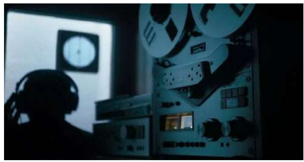
చేకారన్నదానిపైనే విచారణ జరుపుతున్నారు. ఫలానా వోట్ల డబ్బులు పట్టుకున్నామని వారిని బ్లాక్ మెయిల్ చేశామని ఫలానా వారి వ్యక్తిగత విషయాలు తెలుసుకుని ఆస్తులు రాయించుకున్నారన్న కోణంలోనే పోలీసులు దర్యాప్తు జరుపుతున్నారు. వీటి ఆరోపణలకు మూలం ట్యాపింగ్. ప్రత్యేకంగా వారి రూముల్ని పెట్టుకుని

నిరూపించే బెట్రాబిల్ ఉందా అది మన న్యాయవ్యవస్థను మెప్పిస్తుందా అన్నదానిపై ఎన్నో డౌట్లు ఉన్నాయి. అందుకే టెలిగ్రాఫ్ చట్టం ప్రకారం ఇంత వరకూ ఒక్క కేసు కూడా నమోదు చేయలేకపోయారని నిపుణులు చెబుతున్నారు. తెలంగాణ పోలీసులు టెలిగ్రాఫ్ యాక్ట్ కేసు పెడతామని చెప్పారు కానీ.. ఇంత వరకూ పెట్టారో లేదో స్పష్టత లేదు. ట్యాపింగ్ కేంద్రంగా జరిగిన తప్పిల్లలపై విచారణ ప్రస్తుతం తెలంగాణలో ట్యాపింగ్ ఇప్పూ మీద జరుగుతున్న వ్యవహారం విచారణలు ఏవీ నిజమైన ట్యాపింగ్ కేసు కాదు. ట్యాపింగ్ చేసి ఏం