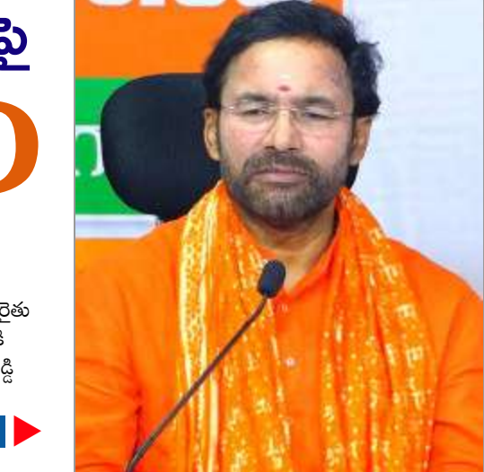
మాట్లాడాలని, దమ్ముంటే రాష్ట్రానికి ఇచ్చిన నిధులపై రాహుల్ గాంధీ చర్చకు రావాలని సవాల్ విసిరారు. రైతు రుణమాఫీ చేస్తామన్న రాహుల్ గాంధీ, అధికారంలోకి వచ్చాక హామీ ఎందుకు అమలు చేయలేదని కిషన్ రెడ్డి ప్రశ్నించారు. మద్దతు ధర అప్పుడు, ఇప్పుడు..