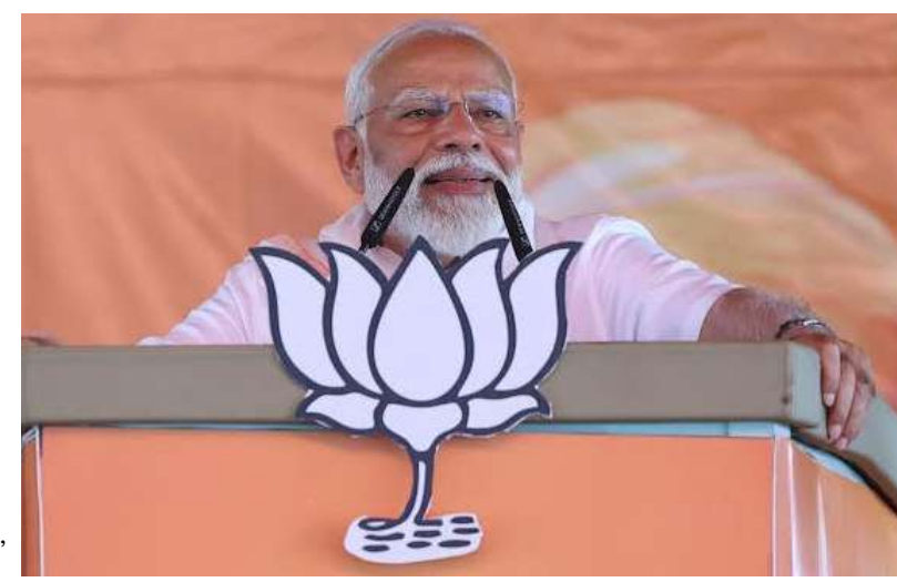
ఏర్పాటు చేస్తే బీజేపీకి మంచి పేరు వస్తుందని మమతా బెనర్జీ భావించారు అని ప్రధాని మోడీ మండిపడ్డారు.

ప్రభుత్వానికి ధన్యవాదాలు అని ప్రధాని మోడీ సెట్టిల్లు చేశారు. దేశానికి 21వ తరతాబ్దం కీలకమైంది. దేశం అభివృద్ధి చెందితే పశ్చిమ బెంగాల్ దానంతట అదే డెవలప్ అవుతోంది. పేదరికాన్ని పారడోలుతామని కాంగ్రెస్ పార్టీ ఏళ్ల నుంచి నినాదాలు ఇస్తుంది. గత పదేళ్లలో 25 కోట్ల మంది ప్రజలను పేదరికం నుంచి విముక్తి కలిగించాం. చిత్తశుద్ధితో, నిజాయితీతో తమ ప్రభుత్వం పనిచేసింది. బెంగాల్ లో మోడీకల్ కాల్కతా చేయాలని భావించాం. రాష్ట్ర ప్రభుత్వం సహకరించలేదు. మోడీకల్ కాల్కతా