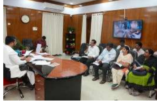
అధికారులను అభివేదికలు, ఎలాంటి లోపాలు తలెత్తకుండా ముందస్తు చర్యలు తీసుకోవాలని, సమన్వయంతో పనులను నిర్వహించాలని చెప్పారు. ఓటింగ్ ప్రక్రియ సజావుగా సాగేలా అన్ని స్థాయిల్లో అధికారులు, సిబ్బంది పూర్తి అవగాహన కలిగి తదుపరి చర్యలు తీసుకోవాలని సూచించారు. అసంతరం ఈబీవెల వినియోగం, హాం ఓటింగ్ పై తీసుకోవాల్సిన చర్యలపై అధికారులకు దిశానిర్దేశం చేశారు.సమావేశంలో

విశాఖపట్టణం ( ప్రశ్న స్వాస్ ) : విశాఖపట్టణంలో జరగబోయే సార్వత్రిక ఎన్నికల క్రమంలో భాగస్వామ్యమయ్యే అభివేదికలు, సిబ్బందికి అందజేసే పోస్టల్ బ్యాలెట్ వినియోగంపై సంబంధిత అధికారులు అవగాహన కలిగి ఉండాలని కింది స్థాయి సిబ్బందికి తెలియజేయాలని జాయింట్ కలెక్టర్ కె. మయార్ అశోక్ పేర్కొన్నారు. తూర్పు నియోజకవర్గ ఎన్నికల సిబ్బందితో బుధవారం సాయంత్రం తన ఛాంబర్లో ఆయన ప్రత్యేక సమావేశం నిర్వహించారు. పోస్టల్ బ్యాలెట్ వినియోగం, శిక్షణ సదుపాయాలు తదితర అంశాలపై కింది స్థాయి అధికారులకు మార్గనిర్దేశం చేశారు. గురువారం జరిగే తొలి విడత రా్యంబడమైషన్ ప్రక్రియ అసంతరం ఆయా నియోజకవర్గాలకు సిబ్బందిని కేటాయిస్తారని దాని ప్రకారం శిక్షణ సదుపాయాల నిర్వహణకు చర్యలు తీసుకోవాలని సూచించారు. ఈ నెల 10, 11వ తేదీల్లో తొలి విడత శిక్షణ ప్రక్రియ పూర్తి చేయాలని చెప్పారు. మే నెల 5వ తేదీ నుంచి ఎన్నికల ప్రక్రియలో భాగస్వామ్యమయ్యే అధికారులు, సిబ్బంది పోస్టల్ బ్యాలెట్ ద్వారా వారి ఓటు హక్కును వినియోగించుకుంటారని... ఆ క్రమంలో ఇప్పటి నుంచే ప్రజాశిక్షణ రచించుకోవాలని సన్నద్ధం కావాలని