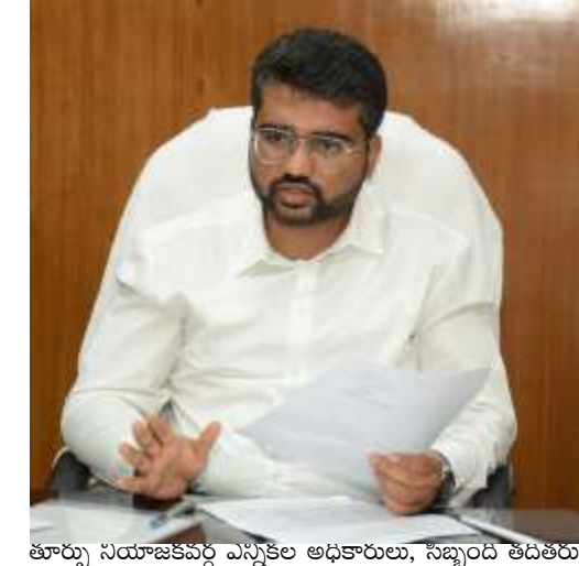
తూర్పు నియోజకవర్గ ఎన్నికల అధికారులు, సిబ్బంది తరఫున తలెత్తిన అభివేదికలను