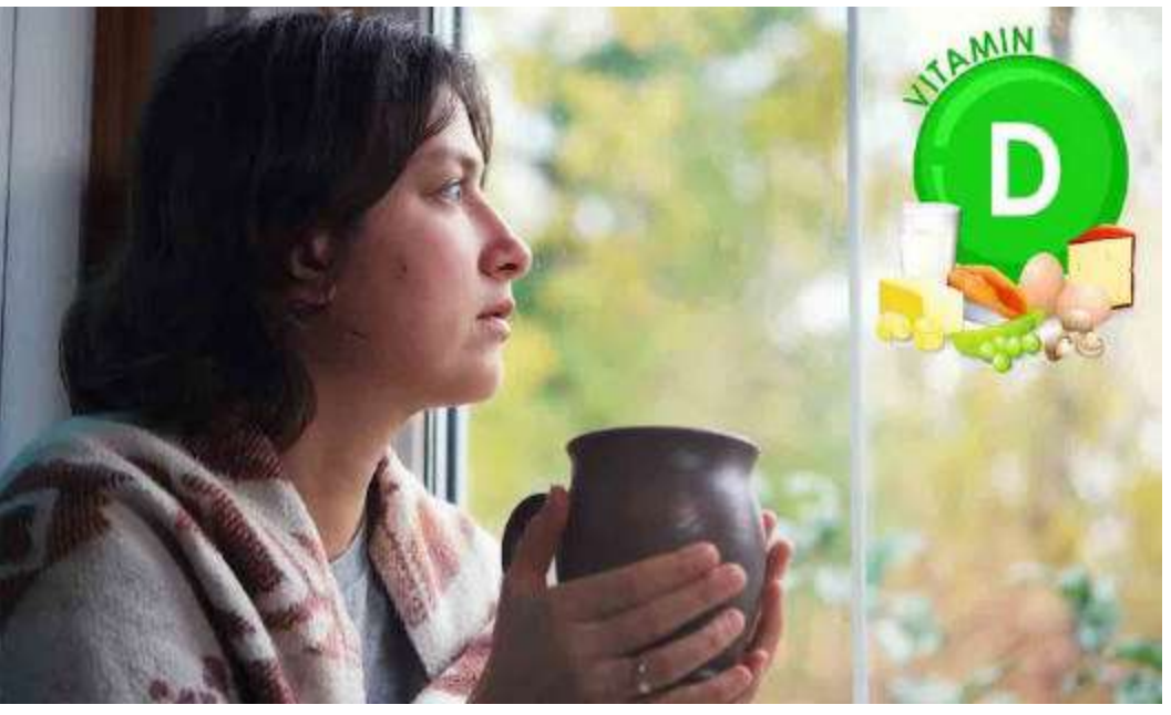
డిప్రెసివ్ ఇన్ఫర్మిటీ. వివిధ ధౌరణీయ ద్వారా వైద్యులు చికిత్స చేస్తారు. వ్యాయామం, సమ తులాహారం ముఖ్యమే.

శీతకాలం రాగానే కొందరిలో తెలియని నీరసం ఆపహిస్తుంది. ప్రతి చలికాలం ఇలానే జరుగుతుంటే.. సీజనల్ ఎఫెక్టివ్ డిజార్డర్ (ఎస్ఎఫ్డి)కు గురవుతున్నట్లు లెక్క దీస్తే అంగ్రేలో 'వింటర్ బ్ల్యాస్' అంటారు. ఈ రుగ్మత లక్షణాలు.. మనసులో అకారణ బాధ, నిరుత్సాహం, నిరాసక్తత, అతిగా తినడం, వేగంగా బరువు పెరగడం, అధిక కార్బోహైడ్రేట్లు ఉన్న ఆహారం తీసుకోవాలనే కోరిక కలగడం, అతి నిద్ర, అలసట.. సీజనల్ ఎఫెక్టివ్ డిజార్డర్లను సూచించేవే. చలికాలంలో సూర్యకాంతి తగ్గడం వల్ల శరీరంలోని జీవగడియారం పని తీరుకు అంతరాయం కలుగుతుంది. దీన్నే కారణంగా చెప్పవచ్చు. ఎండ తక్కువగా తగలడం వల్ల రక్తంలో సెరటోనిన్ గా పిలిచే ఫిలోగ్లడ్ హార్మోన్ స్థాయిలు తగ్గిపోతాయి. ఫలితంగా నిరుత్సాహం, కుంగుబాటు అవుతున్నాయి. వంశ పారంపర్యంగానూ వచ్చే అస్థిరం ఉంది. లోపం ఇదే.. ప్రధానంగా విటమిన్-డి తక్కువగా ఉండే ఆహారం తీసుకునే వారు దీని బారిన పడతారు. జాగ్రత్త పడాలిందే.. శీతకాలంలో వచ్చే ఈ సమస్యల్ని అత్యధిక చేస్తే తీవ్ర అనారోగ్యానికి దారితీయవచ్చు. నలుగురిలో కలవ లేకపోవడం, ఆఫీసులో సర్కిల్ పనిచేయలేకపోవడం ప్రధాన లక్షణాలు. మధ్యం, మాదకద్రవ్యాలకు అలవాటు పడవచ్చు. అకారణ దుఃఖం, ప్రతికూల ధోరణులు, అత్యుత్సాహం ఆలోచనలు వెంటాడుతాయి. విటమిన్-డి మాత్రలతో పాటు యాంటీ