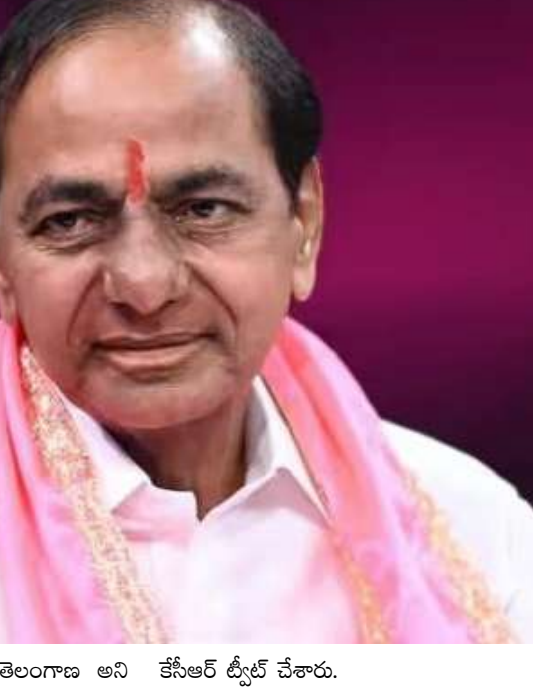
ఇకనైనా ఆలోచించాలని, జై తెలంగాణ అని కేసీఆర్ ట్వీట్ చేశారు.