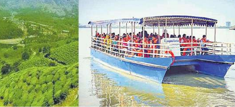
బుకింగ్ ఇలా.. ఈ పర్యటనల కోసం తెలంగాణ టూరిజం డెవలప్ మెంట్ కార్పొరేషన్ వెబ్సైట్ ను సందర్శించవచ్చు. ఆన్ లైన్ లోనే టికెట్లు బుక్ చేసుకోవచ్చు. మరిన్ని వివరాల కోసం 040%--29801040, 98485 40371