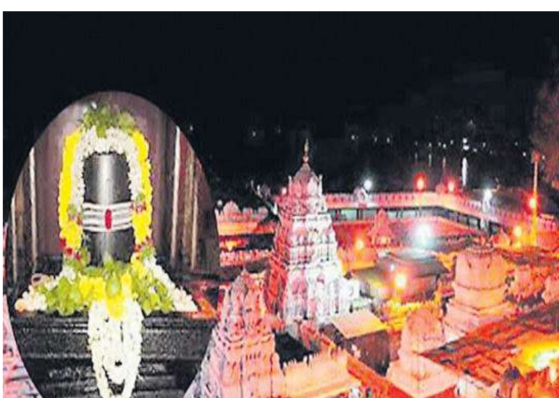
పర్యాటక సందడి తిరిగి మొదలైంది. కోవిడ్ కారణంగా చాలా కాలంగా ఇక్కడే పరిమితమైన సగరవాసులు కాలక్షేపం కోసం పర్యటనలకు ప్రణాళికలు సిద్ధం చేసుకుంటున్నారు. ఈ క్రమంలో తెలంగాణ పర్యాటకాభివృద్ధి సంస్థ పర్యాటకుల ఆధిరువికి అనుగుణమైన వ్యాకేజీలను రూపొందించింది. సగరంలోని చారిత్రక, పర్యాటక ప్రాంతాలను సందర్శించేందుకు ఏసీ, నాన్ ఏసీ బస్సుల్లో హైదరాబాద్ నుండి సదుపాయాన్ని అందుబాటులోకి తెచ్చింది.