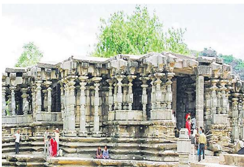
జూపార్కు తారామతి బారాదరి, గోల్కొండ తదితర పర్యాటక ప్రాంతాలను సందర్శించవచ్చు. ఈ పర్యటన కోసం ఏసీ వాహనాల్లో రూ.350, నాన్ ఏసీ వాహనాల్లో రూ.250 వరకు చార్జీ ఉంటుంది. పర్యటనలో భాగంగా డిప్లీస్, భోజనం, వివిధ ప్రాంతాల్లో సందర్శన టికెట్ల రుసుము పర్యాటకులే చెల్లించాల్సి ఉంటుంది. రవాణా సదుపాయాన్ని మాత్రమే పర్యాటక అభివృద్ధి సంస్థ కల్పిస్తుంది. హాస్పిటాలిటీలో బోటు షికార్ కూడా అందుబాటులోకి తెచ్చారు. కాకతీయ రిజియన్ యాత్ర: ఉదయం 9.30 గంటలకు హైదరాబాద్ నుంచి బస్సు బయలుదేరుతుంది. 2వ రోజు రాత్రి 9 గంటలకు తిరిగి చేరుకుంటారు. కాళ్ళేళ్లం, రామప్ప, వేయిస్తంభాల గుడి, యాదాద్రి, కీసర తదితర పుణ్యక్షేత్రాల సందర్శన ఉంటుంది. పెద్దవారికి రూ.1,550, పిల్లలకు రూ.1,320 చొప్పున చార్జీ ఉంటుంది.