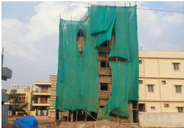
ప్రజాప్రతినిధులు, టౌన్ ప్లానింగ్ అధికారులు కుమ్ముత్ర అక్రమ నిర్మాణాలను ప్రోత్సహిస్తూ భారీగా అవినీతి సాము

కాప్రా (ప్రశ్న స్మార్స్) కాప్రా సర్కిల్ పరిధిలోని పలు కాలనీల్లో వెలుస్తోన్న అక్రమనిర్మాణాలకు అడ్డు ఆడుతుంటున్నాడంటూ పోతొంది. నిబంధనలను ఉల్లంఘించి ఇష్టానుసారంగా నిర్మాణాలు చేపడుతున్న టౌన్ ప్లానింగ్ అధికారులు కన్నెత్తి చూడటం లేదనే ఆరోపణలు వినిపిస్తున్నాయి. కాప్రా, ఏఎస్ రావునగర్, చక్రపల్లి, మిర్చిబల్ హెచ్ఓకాలనీ, నాచారం, మల్లాపూర్ డివిజన్ ల