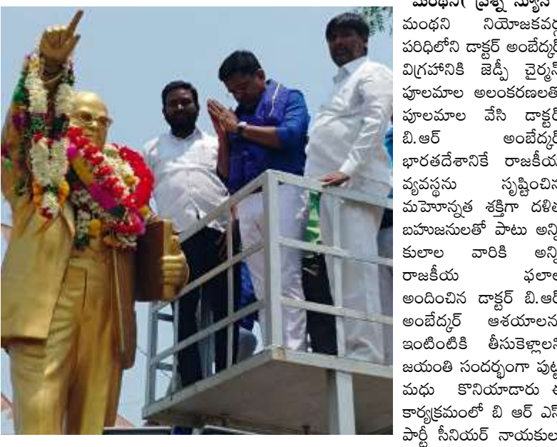
కార్యకర్తలు తదితరులు పాల్గొన్నారు