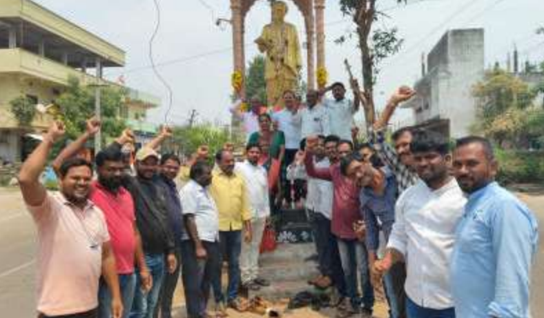
వర్గాల ఆశా జ్యోతి, పీఠిక బడుగు బలహీన వర్గాల పితా మహుడు, పేద ప్రజల బాంధవుడు విద్యా వేత్త, సంఘ సంస్కర్త కు. ఘనంగా నివాళులు అర్పించినారు