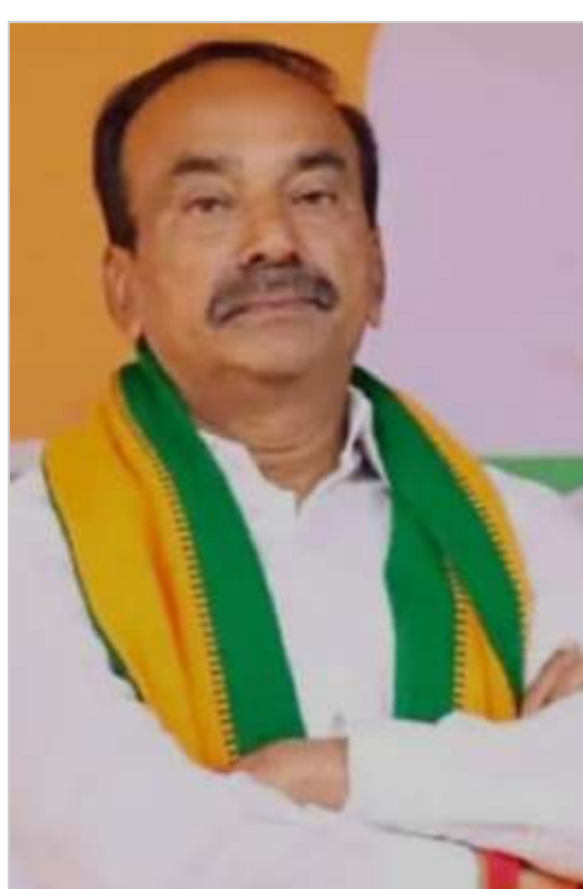
హైదరాబాద్ (ప్రశ్న స్వాస్) బిజెపి నాయకుడు ఈటెల రాజేందర్ కు మల్కాజిగిరి పార్లమెంటు డివిజన్ కేటాయింపులో ఓటమి