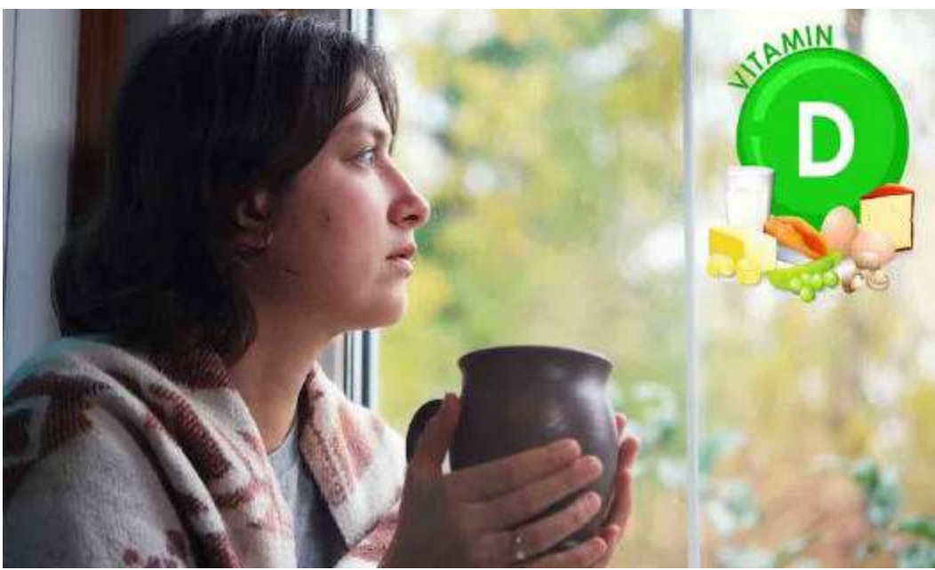
డిప్రెషన్ లాగా ఉంటుంది. వివిధ ధౌరణిక ద్వారా వైద్యులు చికిత్స చేస్తారు. వ్యాయామం, సమ తులాహారము ముఖ్యమే.

శీతకాలం రాగానే కొందరిలో తెలియని నీరసం అవహిస్తుంది. ప్రతి చరిత్రకాలం ఇలానే జరుగుతుంటే.. సీజనల్ ఎఫెక్టివ్ డిజార్డర్ (ఎన్ఎస్డీ) గురవుతున్నట్లు లెక్క దీన్ని ఆంగ్లంలో 'వింటర్ బ్లాస్' అంటారు. ఈ రుగ్మత లక్షణాలు.. మనసులో ఆకారణ బాధ, నిరుత్సాహం, నిరాసక్తత, అతిగా తినడం, మేగంగా బరువు పెరగడం, అధిక కార్బోహైడ్రేట్ల ఉన్న ఆహారం తీసుకోవాలనే కోరిక కలగడం, అతి నిద్ర, అలసట.. సీజనల్ ఎఫెక్టివ్ డిజార్డర్ను సూచించేవే. చరిత్రకాలంలో సూర్యకాంతి తగ్గడం వల్ల శరీరంలోని జీవగడియారం పని తీరుకు అంతరాయం కలుగుతుంది. దీన్నొక కారణంగా చెప్పవచ్చు. ఎండ తక్కువగా తగలడం వల్ల రక్తంలో సెరటోనిన్ గా పిలిచే ఫిటీగుడ్ హార్మోన్ స్థాయిలు తగ్గిపోతాయి. ఫలితంగా నిరుత్సాహం, కుంగబాటు అవహిస్తాయి. వంశ పారంపర్యంగానూ వచ్చే ఆస్కారం ఉంది. లోపం ఇదే.. ప్రధానంగా విటమిన్-డి తక్కువగా ఉండే ఆహారం తీసుకునే వారు దీని బారిన పడతారు. జాగ్రత్త పడాలిందే.. శీతకాలంలో వచ్చే ఈ సమస్యల్ని ఆశ్రయ చేస్తే తీవ్ర అనారోగ్యానికి దారితీయవచ్చు. నలుగురిలో కలవ లేకపోవడం, ఆఫీసులో సరిగ్గా పనిచేయలేకపోవడం ప్రధాన లక్షణాలు. మధ్యం, మాదకద్రవ్యాలకు అలవాటు పడవచ్చు. ఆకారణ దుఃఖం, ప్రతికూల ధోరణులు, అత్యుపశ్చ అలోచనలు వెంటాడుతాయి. విటమిన్-డి మాత్రంతో పాటు యాంటీ