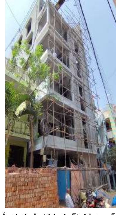
సీతాఫలమంది (ప్రశ్న స్వాస్) సికింద్రాబాద్ సర్కిల్ పరిధిలో అక్రమ నిర్మాణాలకు హద్దు అదుపు లేకుండా పోయింది. అధికారులు చర్యలు తీసుకుంటున్నా నోటీసులు ఇస్తున్నాం ఇవన్నీ హరికథలు బలకథలు అంటూ ప్రజలు అగ్రహం వ్యక్తం చేస్తున్నారు. నిబంధనలకు అగ్రహం రెండు అంతస్తులకు విరుద్ధంగా రెండు అంతస్తులకు అవినీతి

గనగనసలు వినిపిస్తున్నాయి. అంతా చైన్ మెన్ లే చేస్తున్నారా? సికింద్రాబాద్ సర్కిల్ టౌన్ ప్లానింగ్ పరిధిలో జరుగుతున్న అక్రమ నిర్మాణాలపై పూర్తిస్థాయి అవగాహన ఉన్న చైన్ మెన్ లు ఎందుకు చర్యలు తీసుకోవడం లేదన్న ఆరోపణలు వినిపిస్తున్నాయి. చైన్ మెన్ కనుసైగల్లోనే అక్రమ నిర్మాణాలు జరుగుతున్నాయని అధికారులకు ఫిర్యాదు చేస్తే తప్ప చర్యలు తీసుకునే దుస్థితి లేకుండా పోయింది. అది కూడా మొకుబ్బాగా తూతూ మంత్రంగా కూల్చివేతలు చేసి కూల్చివేసిన సంగతి కూడా మీడియాకు చెప్పకపోవడం వెనుక అంతర్లం ఏమిటో వాళ్లకే తెలియాలి. పూర్తిస్థాయిలో కూల్చివేయాల్సిన అక్రమ నిర్మాణాన్ని ఏదో చిన్న గోడ తొలగించి అక్రమ నిర్మాణాలతో సెటిల్మెంట్ చేసుకొని లంచాలు తీసుకొని చిన్నగా గోడను తొలగించి వెళ్లడం కూల్చివేసామని చెప్పుకోవడం టౌన్ ప్లానింగ్ అధికారుల అవినీతికి నిదర్శనంగా మారిన దీనిని ఉద్యోగ డ్రోహం గా ప్రజలు పేర్కొంటున్నారు. ఇప్పటికైన చైన్ మెన్ అవినీతి అక్రమాలపై విజిలెన్స్ అధికారులు దృష్టి సారించాలని కోరుతున్నాం.