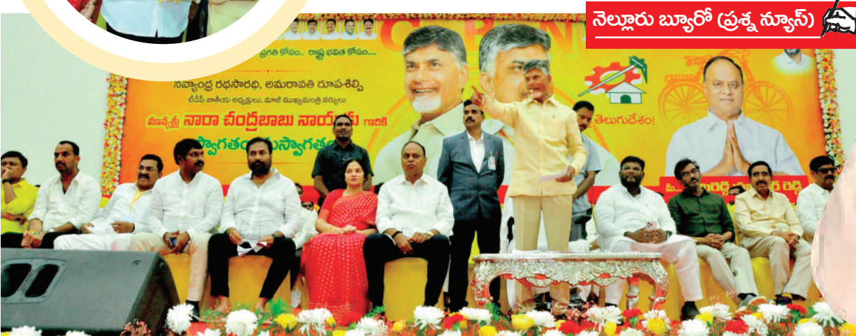
నెల్లూరు బ్యారో (ప్రశ్న న్యూస్)