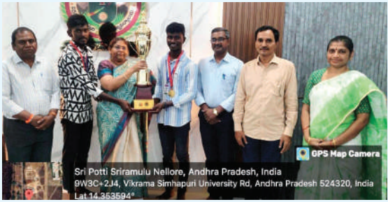
Sri Potti Sriramulu Nellore, Andhra Pradesh, India 9W3C+2JA, Vikrama Simhapuri University Rd, Andhra Pradesh 524320, India Lat:14.353594°