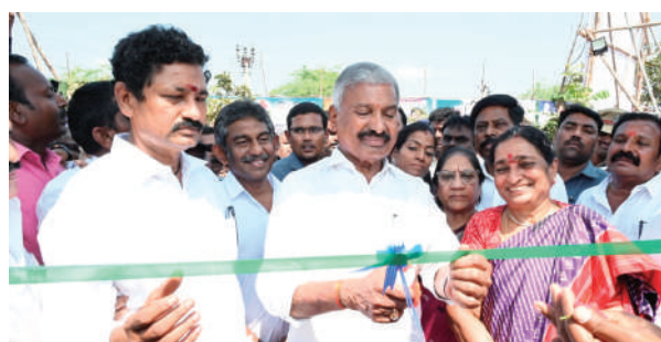
నాయుడుపేట ప్రతినిధి( ప్రశ్న న్యూస్ ) : తిరుపతి జిల్లా మేనకూరులో సెజ్ ఏర్పాటు చేసి ఈ ప్రాంత అభివృద్ధికి ఎనలేని కృషి చేసిన మాజీ ముఖ్యమంత్రి